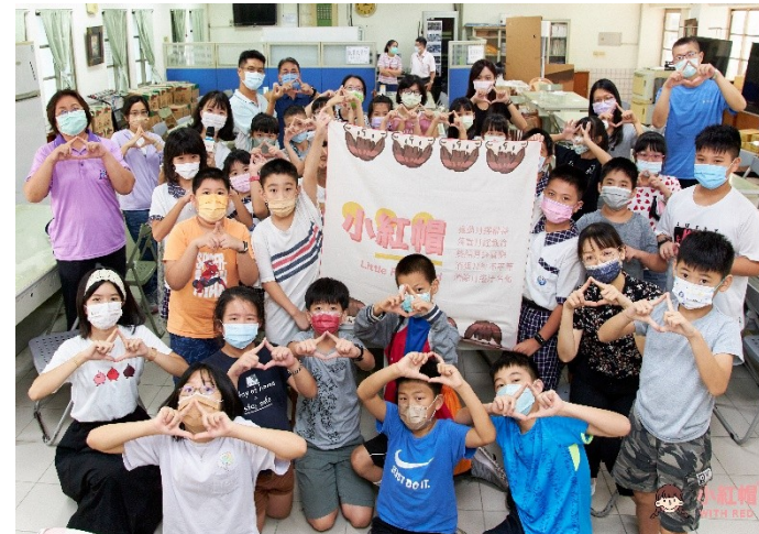
全球小紅帽協會到校宣導