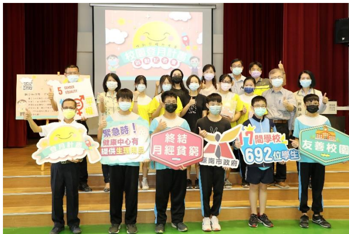
於學校辦理校園 登月計畫記者會