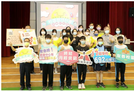
於學校辦理校園 登月計畫記者會