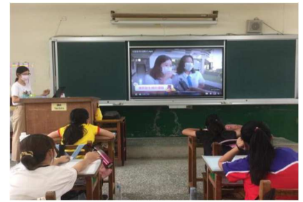
教師宣講月經教育課程