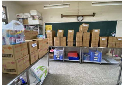
愛心企業捐贈每生 每月2份生理用品