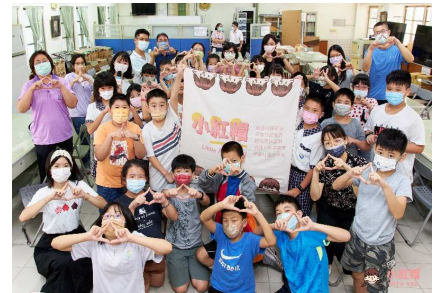
全球小紅帽協會到校宣導