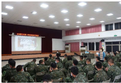
於軍方辦理性平講座宣導