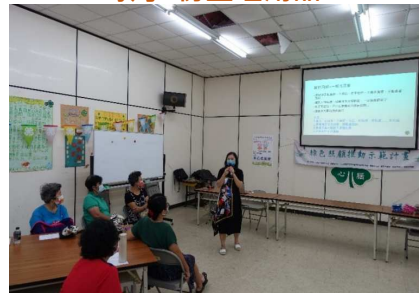
於農會辦理性平講座宣導