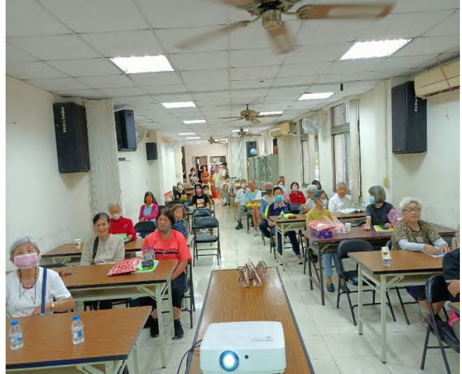
利用文宣宣導性別平等觀念-手舉牌宣導