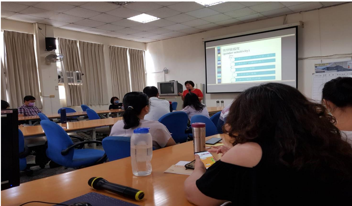
課程講解性別平等