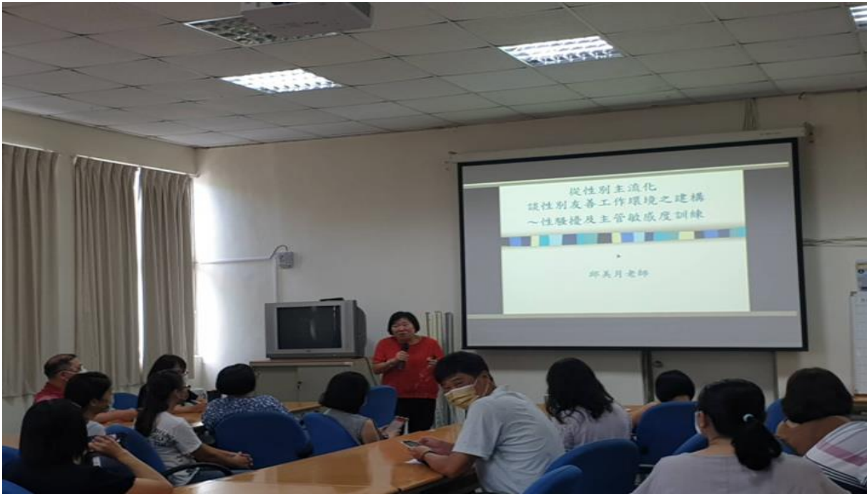
課程講解性別平等