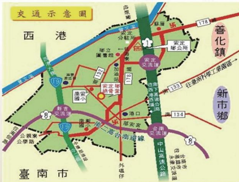
圖1-1-8 本鄉對外交通示意圖