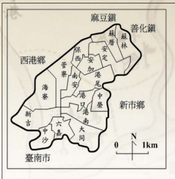
圖1-1-2 臺南縣安定鄉十六個村及其毗鄰的鄉鎮市

日治時期(1895-1945)多次行政區變更，有3縣1廳、1縣1廳2支廳、6縣3廳、3縣2廳、20廳、12廳、5州2廳、5州3廳等變革。 8 根據《臺灣堡圖》，日治初，本鄉鄉域包括安定里東堡和西港仔堡，其中安定里東堡下轄的大字庄有：胡厝寮庄、蘇厝庄、直加弄庄、港仔尾庄、港口庄、六塊寮庄等；管寮庄、海寮庄、新吉庄則屬西港仔堡。安定里東堡和西港仔堡，在3縣1廳時期(1896-1897)，屬臺南府