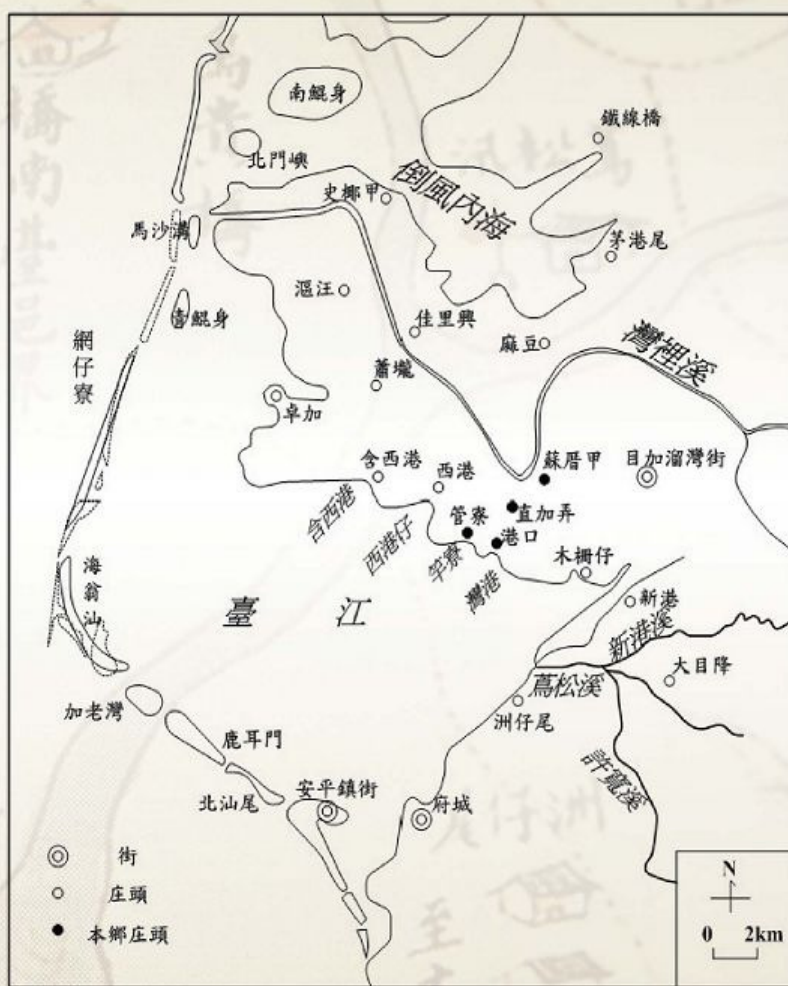
圖1-1-7 康熙年間本鄉與臺江的位置圖