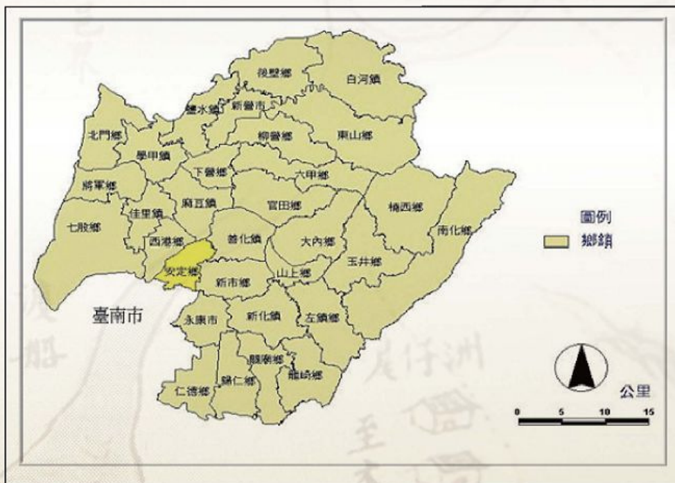
圖1-1-1 臺南縣安定鄉地理區位圖

臺南縣有2市7鎮22鄉，合共31個鄉鎮市，安定鄉為其中的一個鄉，東與善化鎮、新市鄉為鄰；北與麻豆鎮，西與西港鄉，皆隔曾文溪相望；南則鄰臺南市安南區。（圖1-1-1）因瀕臨曾文溪，昔日曾文溪河道的變遷，對本鄉影響甚大；今日因緊臨臺南市，隨著臺南市的發展，帶動本鄉成為都市外圍的住宅區、工業區，重要性日益增加。