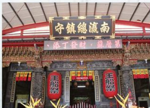
圖7-1-9 真護宮三川門景觀

真護宮一樓正殿為五府千歲殿，供奉主祀代天巡狩李、池、吳、朱、范五府千歲，以及統兵馬大元帥、鎮海大元帥、管船大將軍、水炮將軍、田都元帥等神祇。二樓為天上聖母殿，奉祀天上聖母、福德正神、註生娘娘等神尊；左右並設有太歲