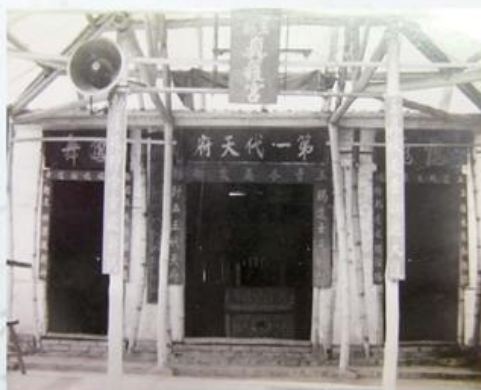
圖7-1-11 真護宮舊廟