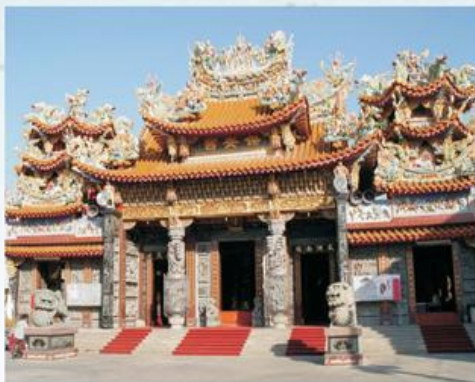
圖7-1-14 安定保安宮現貌

保安宮創始自清嘉慶元年（1796），初建廟於大道公營（今安定鄉蘇厝村南五百公尺「宮九堀」附近）。昔日大道公