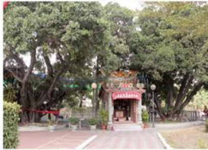
圖7-1-36 六塊寮龍虎堂及榕王公

龍虎堂的興建與流經六嘉村的「六塊寮排水」大溝有密切關係。「六塊寮排水」係由庄北的南安村「油車」經大同村南流而來，此段叫「管寮中排水」，之後再流經臺南市「溪頂寮」注入鹽水溪。早年在「管寮中排水」流域中正好經過兩村的墳墓區，大量的屍水排入溝渠成為名副其實的「陰水溝」。民間習俗認為由墳場流出的水流是帶有煞氣的「陰水」，凡被流經的村庄會因煞氣陰水破壞地理，輕則庄衰人病，重則庄敗人亡。因此為了避免煞氣侵襲，必須在水流處制水祭煞以確保庄眾平安。