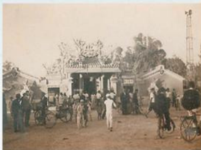
圖7-1-26 福安宮舊照

據《安定庄寺廟臺帳》的記載，本廟列冊信徒有500人，含括港子尾的全部居民，現在信徒約有三百一十戶。