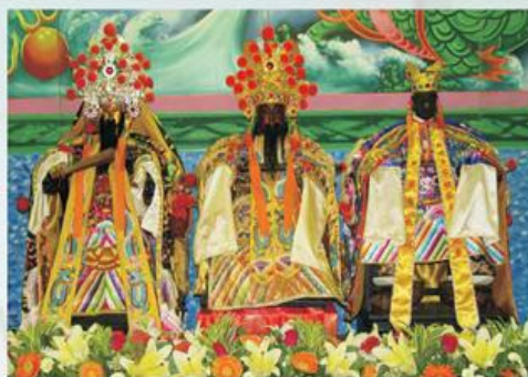
圖7-1-16 民國98年舉辦「再續百年緣大道公會香」活動，促成保安宮紅面大帝與學甲慈濟宮黑面大帝、洲仔尾保寧宮金面大帝，三尊軟身大帝逾百餘年後再度的相聚會香。

主要為春秋二祭。為共同慶祝三月十五日保生大帝與三月廿三日天上聖母聖誕，遂於三月擇日舉行「春祭」；九月擇日舉行之「秋祭」，則為慶祝六月十六日田府元帥、九月初九中壇元帥聖誕，兩者是日舉行祝壽典禮、敬演梨園、犒賞