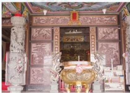
圖7-1-45 聖懿宮普庵堂三川步口

普庵堂主祀普庵祖師，同祀天上聖母、九天玄女、溫府千歲、中壇元帥、哪吒三太子、福德正神與虎爺等神祇，並安置內外五營。普庵祖師又稱普庵禪師、普庵祖師，禪門臨濟宗高僧，生於宋徽宗政和5年（1115），袁州宜春人（今江西省宜春市袁州區），俗姓余。宋高宗紹興4年（1134）出家。一日讀《華嚴經》至「達本情忘，知心體合」，頓時悟道。乾道5年（1169）圓寂。 45 由於在世時靈驗事蹟不斷，普庵祖師圓寂後逐漸受到人民信仰，成為一位專門消災解厄的神祇。