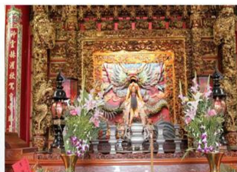
圖7-1-25 福安宮主祀神保生大帝