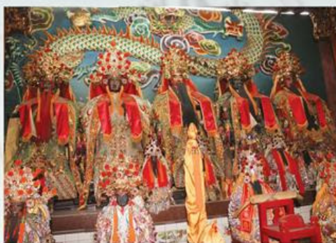
圖7-1-10 真護宮正殿供奉的五府千歲神像

據〈蘇厝第一代天府真護宮沿革〉 15 的記載，真護宮開基主神代天巡狩李府千歲的發源祖家為查畝營（今柳營鄉）「遊王會」 16 。清朝年間一艘由查畝營放流而出的代天巡狩王船，船上載有「一組總趕（公）含一支王令」，停靠在林厝庄聚落舊址的曾文溪畔，約在今善化鎮西衛庄北方5百公尺處。經請示林厝庄玄天上帝神意後，將王船留祀以保境安民。後林厝庄與蘇厝庄共同建廟奉祀，始稱「蘇林二庄代天府」。因視柳營「遊王會」為發源祖家，所以民國47年（1958）農曆4月，李府千歲神轎與宋江陣、天子門生等陣頭曾前往柳營王己元爐主家中過爐謁祖。