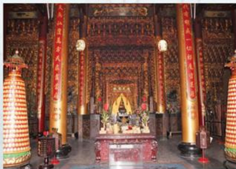
庄民認知此船係自中國大陸東南沿海 圖7-1-7 長興宮正殿祭祀空間

據廟方文獻記載，本廟奉祀玉勅代天巡狩，溯其肇建淵源，係緣起於明永曆33年(1679)某夜，臺江埔地突有一船隨著潮水漂入臺江，擱淺在蘇厝庄西的海埔地。翌晨庄民登舟探望，只見艙內遍插12支綢製令旗，上書「玉勅代天巡狩十二行瘟王」及總趕公與全套紙糊水手、班役。