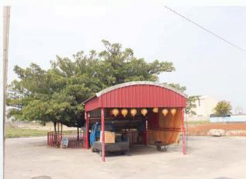
圖7-1-23 二虎大將軍伏居處的老榕樹

據稱二虎大將軍的由來，係源於日治末期（約1940年前後），二虎大將軍的精靈潛伏於老榕樹。直到民國70年（1981）左右，二虎大將軍的精靈才被村民發現，經南安宮諸神指示，庄民乃搭建鐵皮小祠設香座以供奉二虎大將軍。