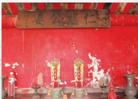
圖7-1-6 應靈善祠內奉祀情形