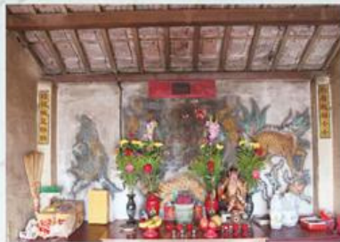
圖7-1-33 渡仔頭樹皇公廟

樹皇公廟位於中榮村的渡仔頭部落，主祀樹皇公，同祀虎爺。廟內神龕壁墨書「樹皇」神位而不雕塑像，神龕兩側有一幅對聯「別看我廟小小，膽敢作惡瞧瞧」，深具警世教化的意涵。