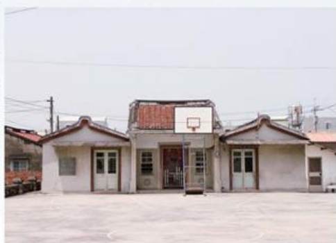
圖7-1-4 原在十樣槓仔腳的北玄宮舊公曆

據北玄宮民國86年（1997）〈北玄宮遷建誌略〉的記載，公曆年久失修，且空間不敷使用，林厝居民乃於民國79年（1990）召開信徒大會，決定整理自清代所留下的林厝公墓地作為建廟的廟地。民國80年（1991）動工興建，進行整地及骨骸安頓工作，耗費金錢達300餘萬元。當時未整地時本廟基金僅有23萬餘元，經費非常短缺；經由社會各界人士及善心大德有錢出錢、有力出力，配合各種物資的捐贈，始得由原來的公曆移駕至今臨時搭建鐵厝廟宇安座。