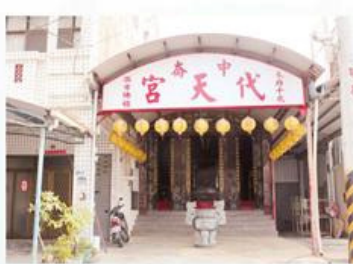
圖7-1-31 中崙代天宮外觀

主祀朱府千歲，同祀虎爺，不設外五營，僅設內五營。據本廟〈歲次壬申年代天宮朱府千歲建廟捐款芳名碑〉的記載，得知本廟建於民國81年（1992），係中崙部落的居民近年所建的廟宇。正殿「保境佑民」匾，為民國81年（1992）葭月吉置，祝代天宮落成誌慶，由中崙忠安宮眾爐下敬獻。例祭日為農曆四月廿五日朱府千歲聖誕，請法師主持賞兵儀式。