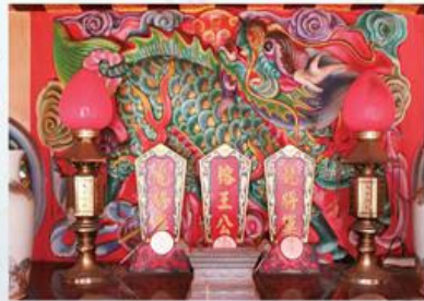
圖7-1-37 龍虎堂榕王公、龍將軍、虎將軍神位

順著「六塊寮排水」流入「六塊寮」的「管寮中排水」陰煞，直衝庄中而來，加上寒冬時墓地陰冷之氣也隨著凜冽的北風吹入庄內，上下夾擊的煞氣陰水讓庄民惡運連連，庄運衰敗，時常有意外事情發生，警覺的庄民見事態嚴重乃迎請庄神金安宮溫府千歲巡視化解煞氣。在溫府千歲指示下，村民於大圳溝邊三角空地上種植三棵榕