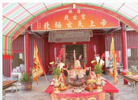
圖7-1-3 北玄宮民國99年元宵節乞平安壽龜及發財金活動