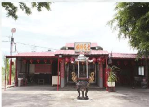
圖7-1-43 七元帥廟供奉七位罹難日本軍人

七元帥廟雖非庄頭公廟，但因其靈驗是基於信眾間口耳相傳，所以也吸引許多信徒前來參拜。據廟內牆壁所張貼七元帥聖誕信徒捐金芳名錄，即有一百廿餘