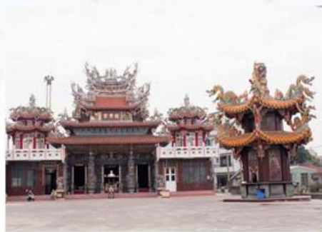
圖7-1-44 新吉村保安宮外觀

新吉村保安宮主祀周府千歲，同祀巫府千歲、代天巡狩、中壇元帥、宋府元帥、福德正神、註生娘娘、虎爺、阿彌陀佛等神祇，為新吉村的庄廟，村民的信仰中心。此外，本廟依俗安置五營，正殿神案設置五營旗式的內五營，廟埕及四境則安置竹符式的外五營。