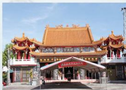
圖7-1-38 港口觀渡宮主祀觀音佛祖

觀音佛祖長期以來皆奉祀於王家民宅，由於神威顯赫，聲名遠播，信眾日漸增加，乃有建廟奉祀之議。所以在民國79年（1990）農曆3月召開信徒大會，討論建廟事宜並成立籌建委員會。同年農曆八月十五日舉行動土儀式，經3年的時間終告完工，並在民國82年（1993）農曆1月24日舉行入火安座。