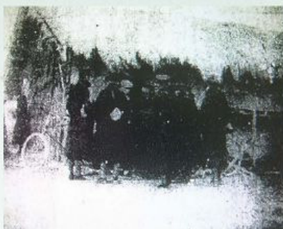
圖2-3-3 日治時期測量圖