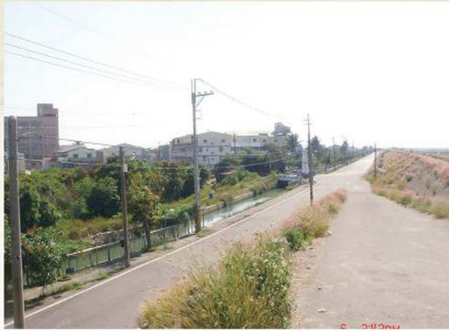
圖1-2-5 安定段之曾文溪堤防 說明：道路右方為堤防，左方為嘉南大圳

再高半公尺，就淹過堤岸了。」這也顯示本鄉的堤防，仍經得起這次百年罕見之大洪水的考驗。(圖 1-2-5) (圖 1-2-6)