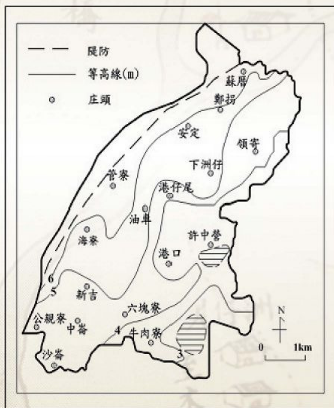
圖1-2-4 安定鄉等高線圖

等高線圖，如圖1-2-4所示。等高線圖顯示本鄉地勢低窪，全鄉在大致10公尺以下，地勢西北高、東南低。下洲仔、油車一線以東在5公尺以下，佔本鄉土地之半，故本鄉地勢低窪，容易遭受水患。本鄉東南，即許中營之南、牛肉寮之東有窪地，全部在3公尺以下，這些窪地，今為魚塭用地。臺江新浮埔出現前，本鄉東南原本就是魚塭用地。蔣毓英的《臺灣府志》記諸羅縣水利時有：「鼎臍挖，在新港之南；潛蟻塭，與鼎臍挖相接，皆產魚蝦。」 41 可知早自康熙25年(1686)即有此二魚塭的記載，很有可能此二魚塭在鄭氏時即已存在。此鼎臍挖魚塭所在，即今牛肉寮東部和新市鄉大洲村間的魚塭。