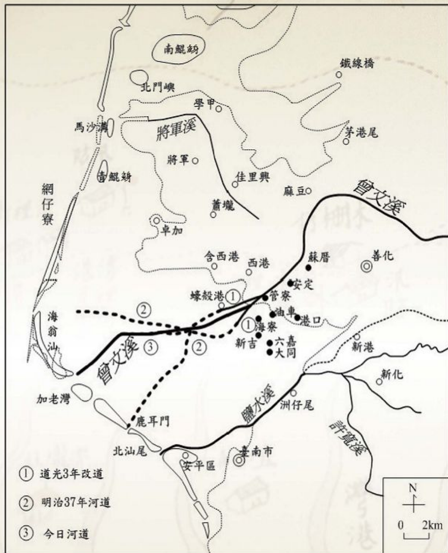
圖1-2-3 曾文溪河道變遷圖(1823~今)

至20世紀初，臺江已全部陸化，根據日人在明治37年（1904）所繪之《臺灣堡圖》顯示延長河後的曾文溪河道分成三支：北支由三股溪出國聖港出海，南支由鹿耳門溪出海，中支延至青草崙尚未出海。而後隨著陸地向西淤填，三股溪下游的國聖港淤填形成今日的七股魚塢及曾文海埔魚塢；南支鹿耳門溪亦不再與曾文溪主流相連，主流在蠔殼港南沖出另一河道，銜接中支青草崙，由此出海。