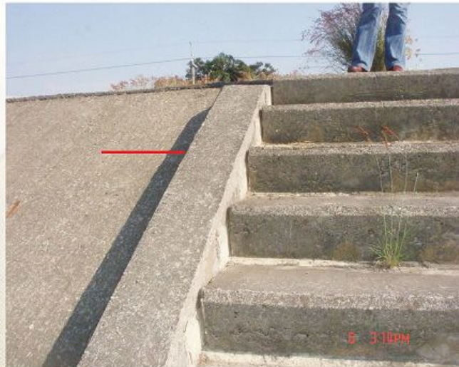
圖1-2-6 安定段之曾文溪堤防 說明：村民指八八水災時，洪水差約半公尺即淹過堤岸