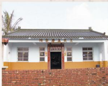
圖3-2-3 港口王裁五房宗祠

港口的王氏，共分成二支，其一，乾隆末年，福建省泉州府同安縣白礁社關帝廟角的王裁來臺，最初定居於今日的新市鄉，後來移居至今本鄉港口村的港口農會一帶定居，建有祖祠，爾後因旅居高雄宗族者眾，又另設立有旅高的宗親會，並設有管理委員會進行管理，於每年的中秋節前夕舉行祭祖；其二，福建的王丁，移入臺灣居住在今日的港口觀渡宮東側縣道西側一帶，稱為「五口灶內王」，建有觀渡宮家廟。