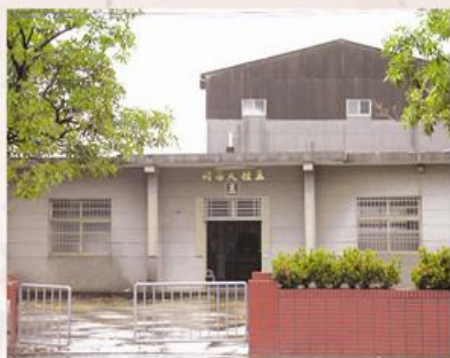
圖3-2-2 安定王姓大宗祠

流擔任爐主，其餘各房將予以協助。此外，王姓宗族繁衍眾多，且其族下之成員無論於政治上或經濟上皆是鄉內的重要人物。