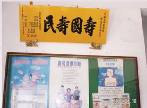
圖9-2-46 管寮衛生室成立時的匾額