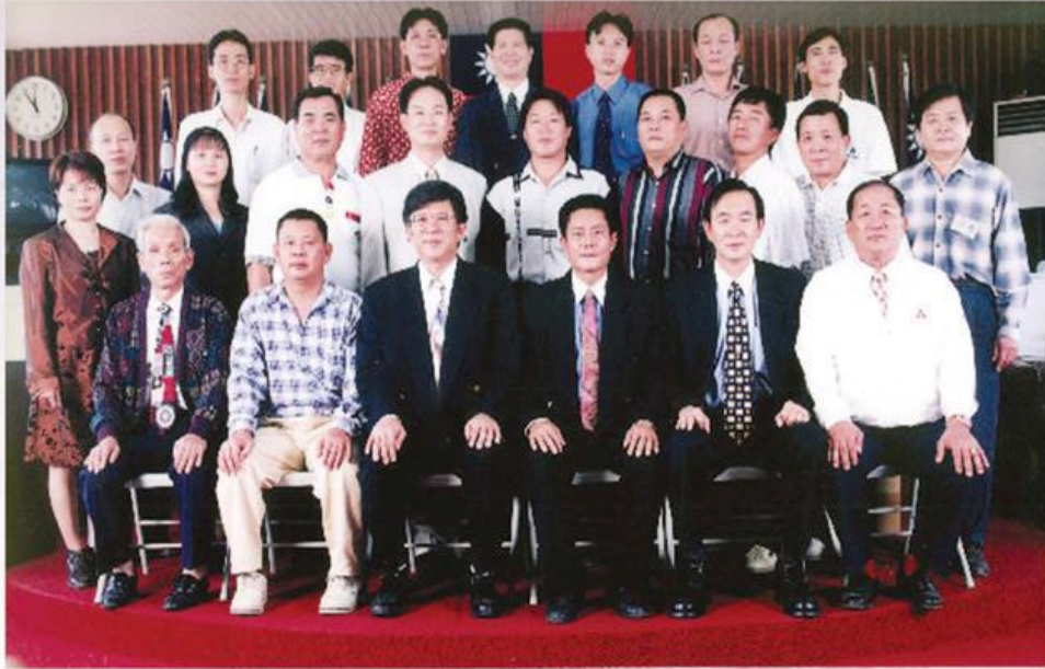
安定鄉民代表會暨鄉公所單位主管合影 87. 8. 1