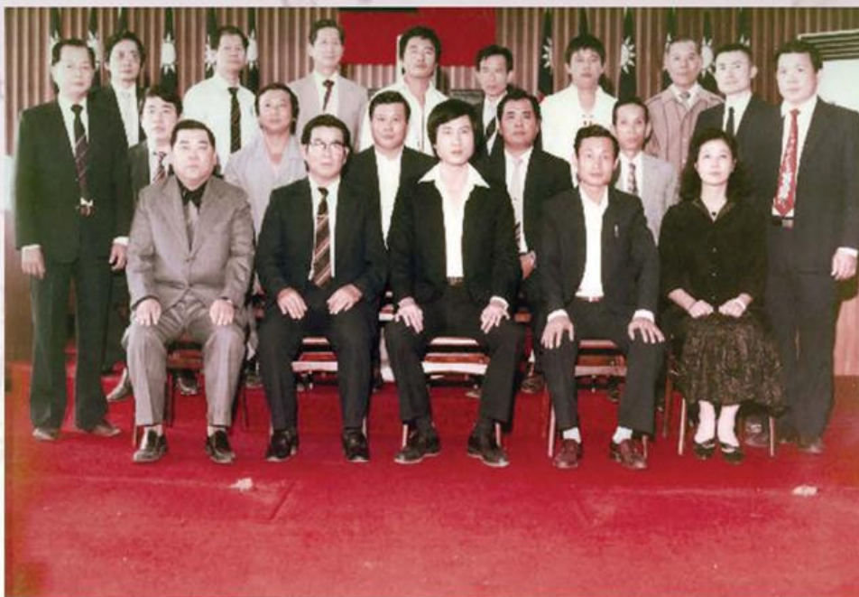
台南縣安定鄉第十三屆鄉民代表暨鄉公所單位主管合影75.8.1