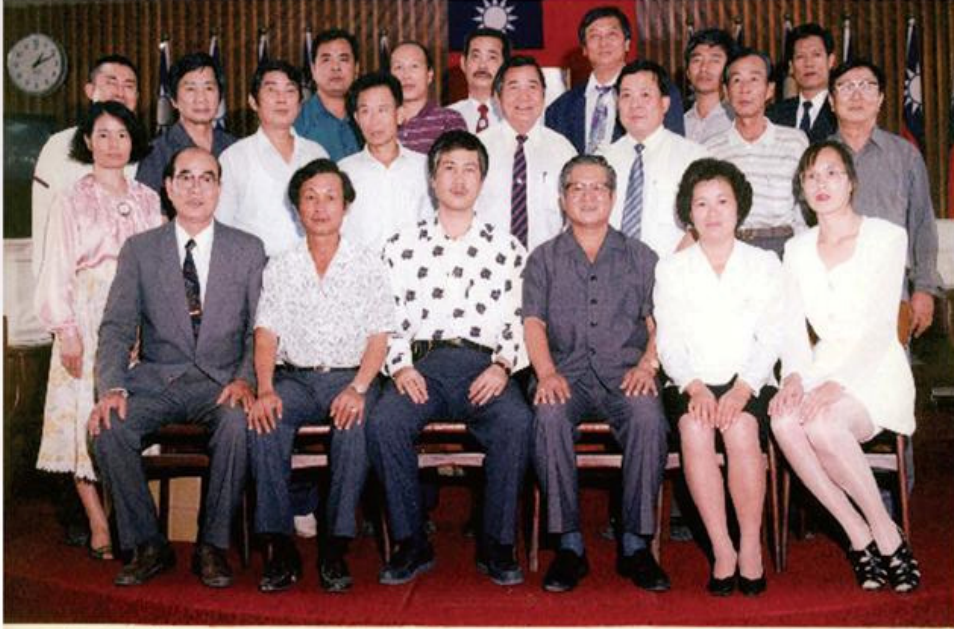
安定鄉鄉民代表會第十四屆代表及鄉公所單位主管合影79、8、1