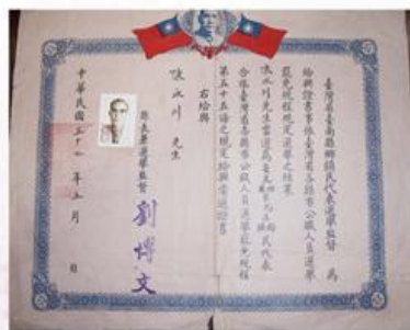
圖9-2-14 第9屆鄉民代表當選證書

本鄉自民國35年選出第1屆，迄民國95年的選舉共有18屆。其間由於地方自治法規不斷修正，第1至6屆鄉民代表選舉是於村民大會中由村公民直接投票，並以村為選舉區；第1至5屆代表任期2年；第6至7屆，代表任期改為3年；第5屆起代表開始有婦女保障名額；第7屆代表起改為依人口數劃分選舉區，由各該選舉區公民選舉之；第8屆代