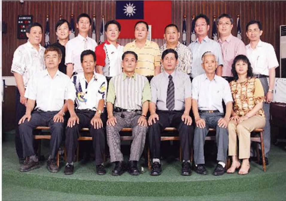
台南縣安定鄉民代表會第十七屆代表合影 91.8.1