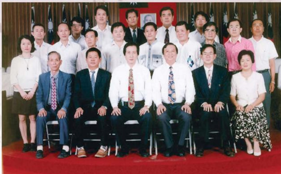
安定鄉民代表會第十五屆代表暨鄉公所單位主管合影 83. 8. 1