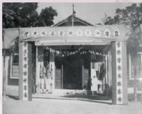
圖9-2-34 蘇厝派出所舊貌