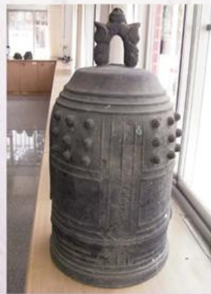
圖9-2-37 海寮派出所保存之日治時期古鐘

海寮派出所日治時期名稱為臺南州新化郡役所海寮警察局官吏派出所。民國34年(1945)8月後，改制為臺南新化區警察所海寮派出所。民國56年(1967)7月善化警察分局成立隨之隸屬迄今。自臺灣光復至民國47年(1958)為2人警員編制，主管由警員擔任兼任管寮、新吉2村警勤區。民國47年(1958)為3人警員編制，主管仍由警員兼任，至民國54年(1965)派巡佐主管專任，警員3名，人員編制4名。民國82年(1993)4月1日海寮村分為2個警勤區，人員編制5名。民國90年(2001)1月3日新吉村分為2個警勤區，人員編制6名。本所位於臺南安定鄉西北端、轄內有海寮村、新吉村、管寮村等3村，面積8.5平方公里，戶數2078戶，人口數6953人。西陲與臺南市警察局第三分局，東銜安定分駐所毗鄰，南鄰港口派出所，北越過曾文溪接佳里分局，因位處於縣、市交接處且腹地空曠，係屬分局重要治安地境。海寮派出所轄區居民以務農為主，工