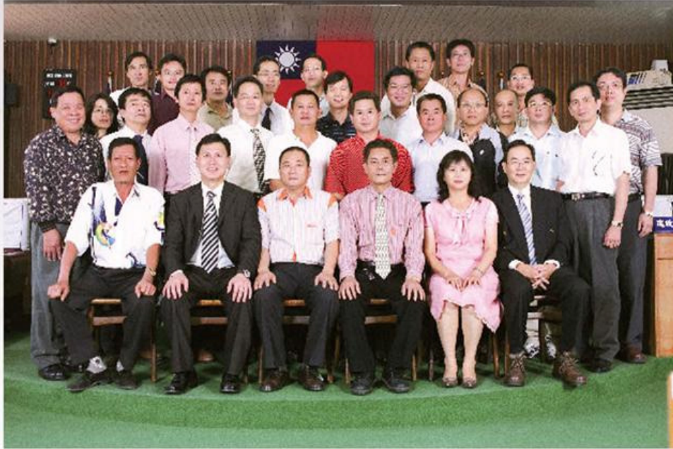
台南縣安定鄉民代表會第十八屆代表暨鄉公所單位主管合影 95.8.1