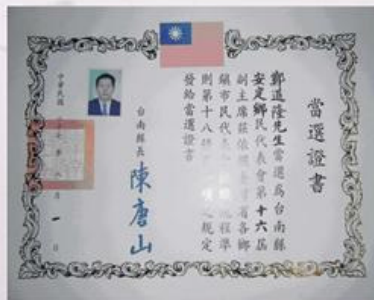
圖9-2-15 第16屆鄉民代表當選證書