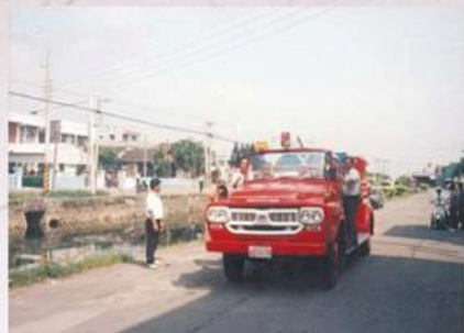
圖9-2-43 在田仔埔旁的消防車

歸屬其管轄內。在民國50年代新化鎮、善化鎮已成立消防警察分隊，新市、安定鄉均未成立消防隊。每當火災發生時則請求臨近消防車支援搶救。俗語說：遠水救不了近火，往往造成災害損失慘重。警察分局所在地之消防單位，成立消防警察分隊。成立消防隊後義勇消防隊員，就歸屬於消防警察隊編制訓練協助救災。但沒有成立消防單位之義勇消防隊員，乃隸屬於各分駐派出所。