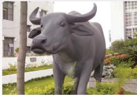
圖9-2-36 港口派出所以水牛塑像作為一所一特色

港口派出所設置於日治時期，民國38年(1949)改為臺南縣警察局新化分局港口派出所，民國56年(1967)7月臺南縣警察局善化分局成立，隨之改隸善化分局管轄，港口派出所在日治時期位於港口菜市場旁之木造廳舍，地址為港南村159號。民國70年(1981)因原辦公廳舍不敷使用故移建現址港南村1-13號辦公。復於民國91年(2002)2月21日