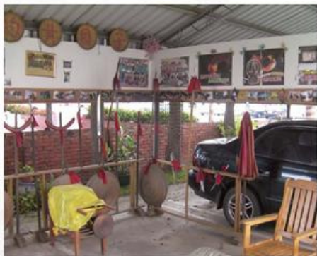
圖9-2-32 安定分駐所以宋江陣武器之擺設作為本所之一所一特色

本鄉在日治時期大正9年(1920)地方改制後，新化郡警察監察區劃分成5個區域，本區隸屬第3監視區，監督駐在地為善化警察官吏派出所，下轄善化、茄拔、東勢寮、六分寮、安定、港口、海寮等7個警察官吏派出所。安定警察官吏派出所分掌區域為安定、胡厝寮、蘇厝、港子尾等聚落。港口官吏派出所下轄港口、許中營、六塊厝、中崙、沙崙等聚落。因為蘇厝人口數眾多，為方便管理，大正14年(1925)時，又將蘇厝警察官吏派出所從安定警察官吏派出所獨立出來，分掌蘇厝及胡厝寮聚落。此時安定庄共有蘇厝、安定、港口、海寮4個官吏派出所。 162 直至今日本鄉的派出所，仍以此4個派出所為主。即有安定分駐所、蘇厝派出所、港口派出所、海寮派出所。