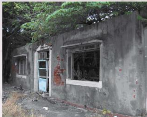
圖9-2-39 日治時期海寮派出所(現已成樹屋)

商企業以小型工廠為多，大部分以生產塑膠射出產品居多，商業以滿足地方日常生活消費的商業批發、零售、服務業、餐飲業等，主要分布在臺19線省道海寮、新吉端兩側。轄內交通要道有19線省道，縱貫南北向、另有國道八號高速公路臺南系統新吉交流道橫貫本轄東西向、南132線鄉道次要道路建構成輻射道路網，交通網路便捷。