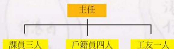
圖9-2-39 安定鄉戶政事務所組織圖

安定鄉戶政事務所地址為(74545)臺南縣安定鄉保西村443之1號。電話：06-5922228、5924668、傳真：06-5920965；現行組織編制置有主任1人、課員3人、戶籍員4人及工友1人，合計員工共9人。 166