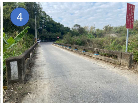
工程範圍現況土地使用情形示意圖