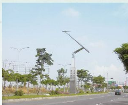
圖2-4-7 南部科學工業園區

大汽車廠為日本豐田汽車公司與中國鋼鐵公司共同投資，於民國71（1982）年12月簽訂合作協議，計畫為年產30萬輛汽車的大廠，政府也對此滿懷期待。民國72年（1983）8月，雙方勘察全臺適合設廠地點後宣布初步選定臺南縣安定鄉、台中縣后里及屏東縣頭前溪三處用地進行討論， 94 其中安定鄉廠址位於海寮村近公親寮及溪埔寮一帶，約有140公頃。在廠址的選定上，中鋼一直屬意安定，但豐田則比較傾向后里，雙方對此一直未有共識， 95 除此之外，亦有許多細節未能談妥，最後日方決定放棄，不僅使我國的汽車夢碎，更影響安定後來的發展。