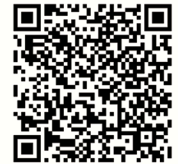
遴選委員 登記表單