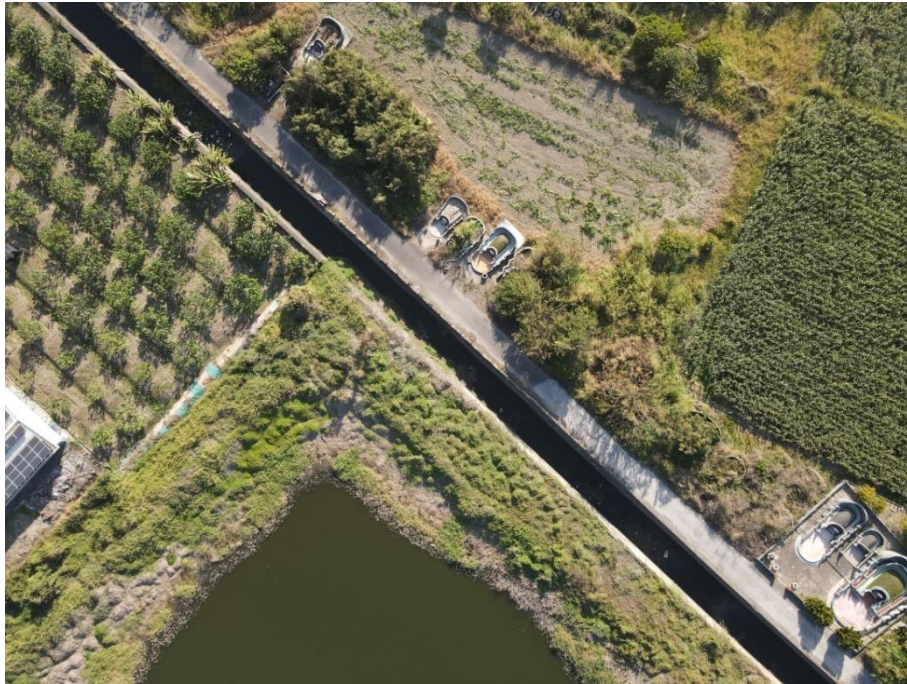
圖 4 現況空拍圖