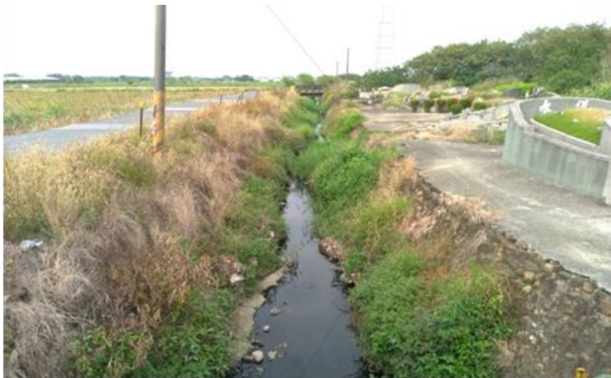
圖 3 用地現況圖