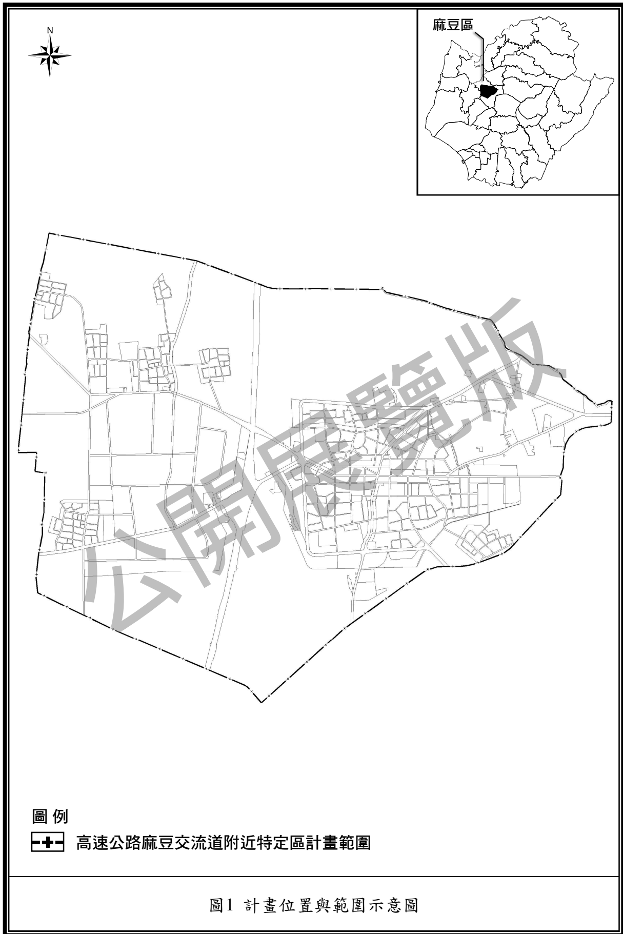
圖1 計畫位置與範圍示意圖