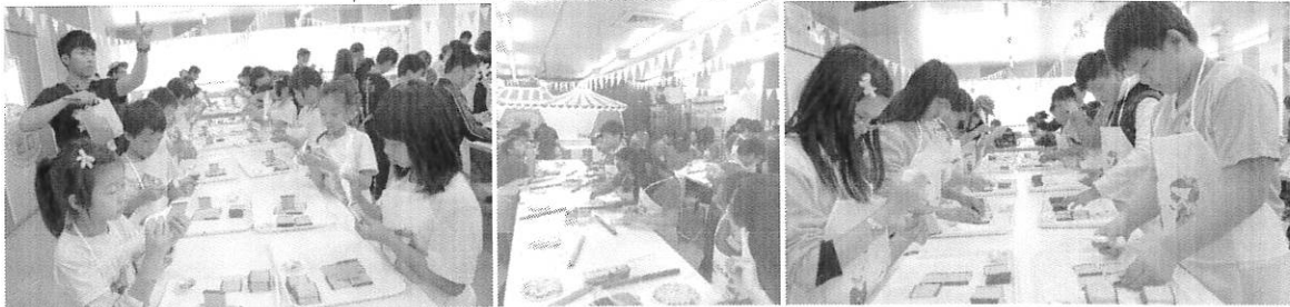
↑ DIY 教學