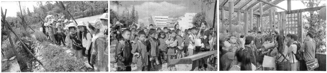
↑ 參觀金格食品-生態池園區