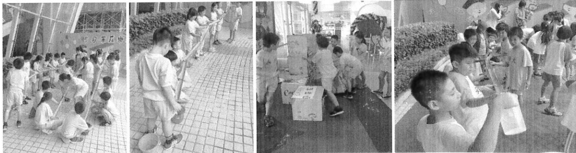
↑ 環境教育趣味遊戲