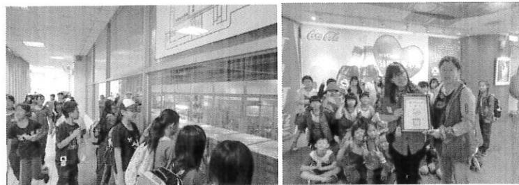
↑ 參觀光泉牛奶園地、可口可樂博物館