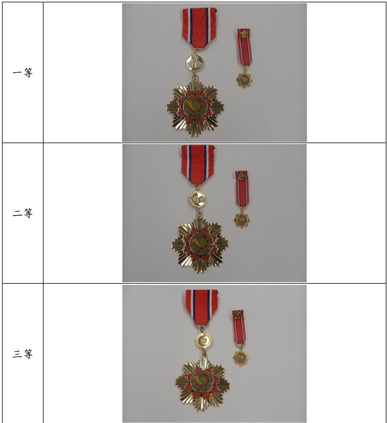
附表二 獎章式樣及圖說