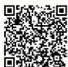
全民防災 e 點通