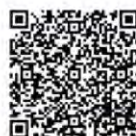
消防防災 e 點通 App (Android)