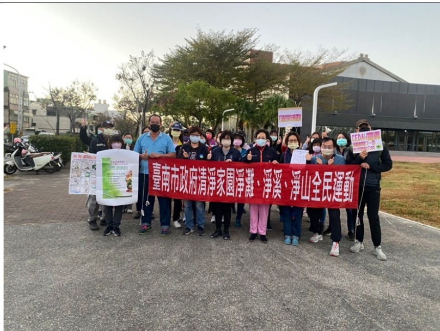
照片說明：CEDAW 宣導(參加人員合照)