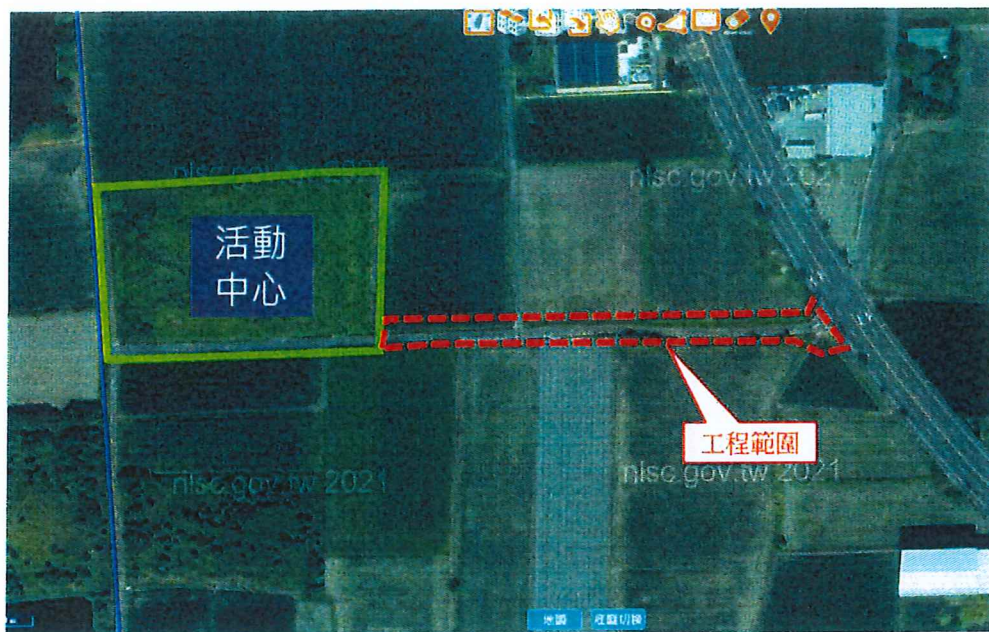
工程範圍現況土地示意圖

分公墓用地為機關用地、綠地用地與道路用地，部分農業區為道路用地) (配合佳里區第二聯合活動中心新建工程) 案」所劃設之路用地，本道路工程預計徵收私有土地已達最小限度範圍，其路線勘選已對土地所有權人影響最低，經評估本計畫道路擬拓寬路段已為最佳路段，無其他可替代之路段。