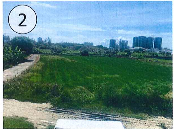
工程範圍現況示意圖

捌、事業計畫之公益性、必要性、適當性及合理性評估報告 針對本興辦事業公益性及必要性之綜合評估分析，依據土