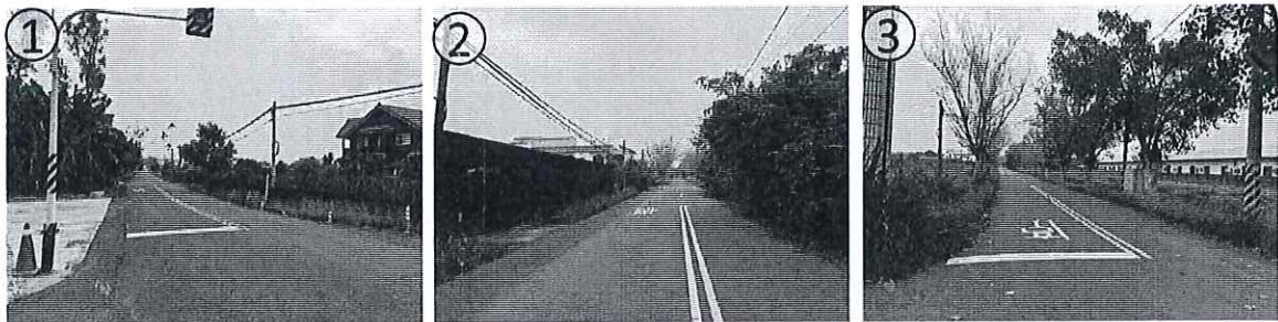
工程範圍現況示意圖