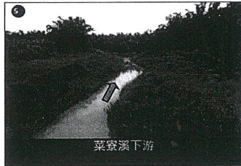
工程範圍土地使用現況示意圖 2