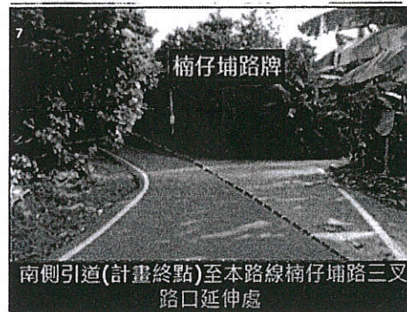
工程範圍土地使用現況示意圖 3