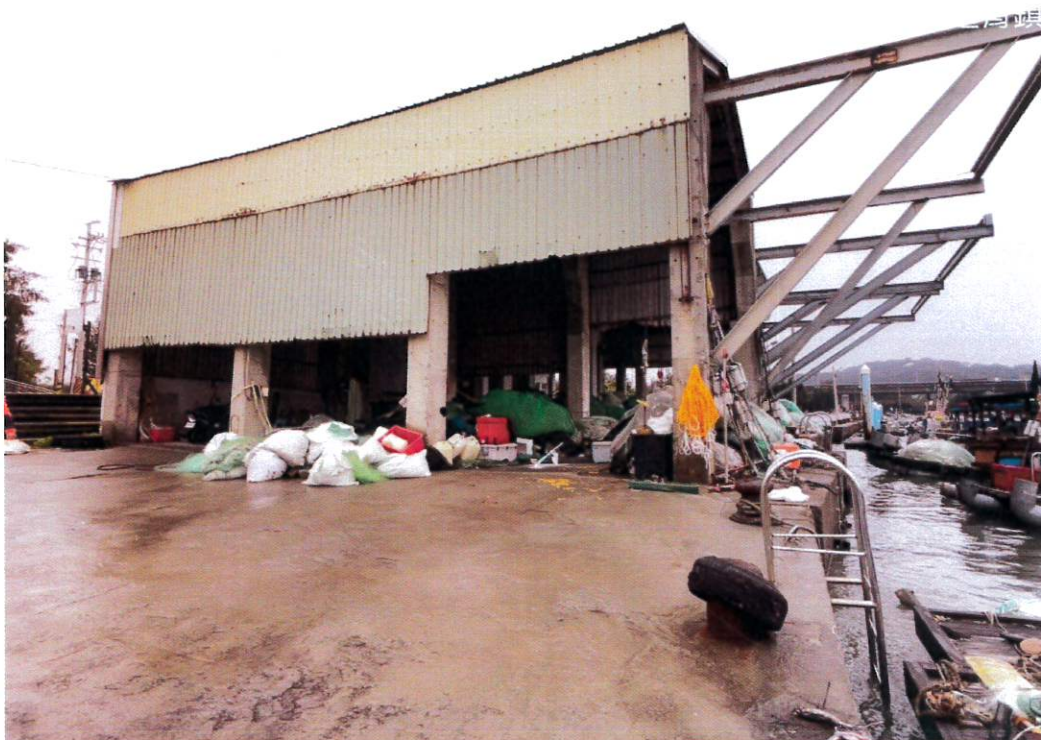
通霄漁港整補場放置物品