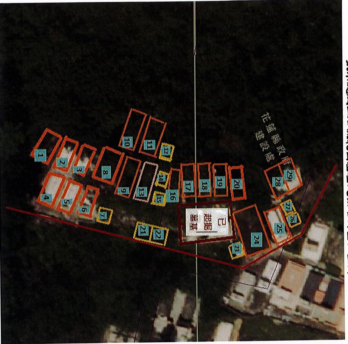
凱米颱風土石流範圍墓基起掘名冊暨位置圖