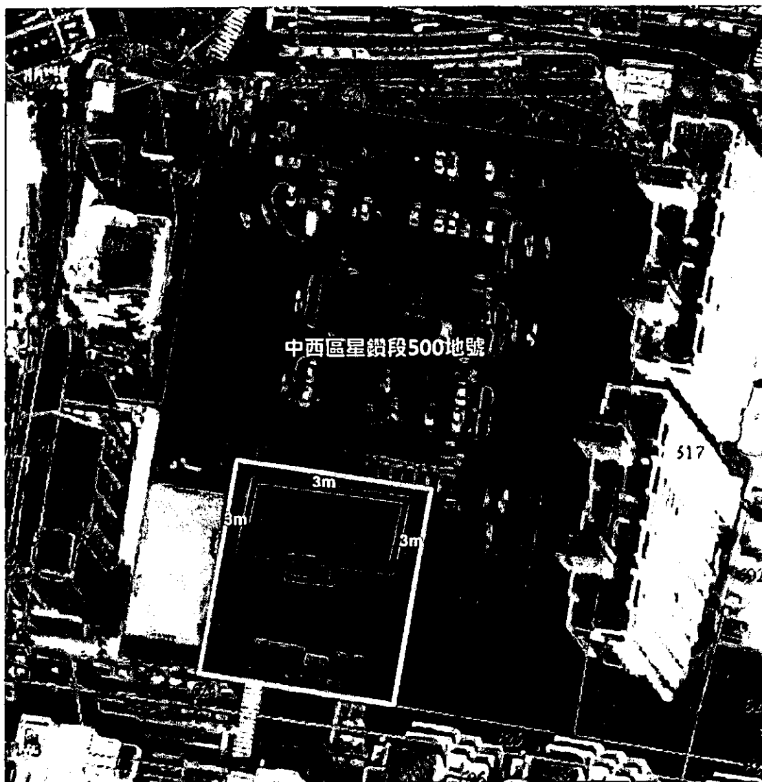
歷史建築「濟生醫院」本體及定著土地範圍示意圖