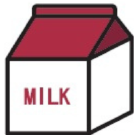
牛奶瓶 / 牛奶盒物件