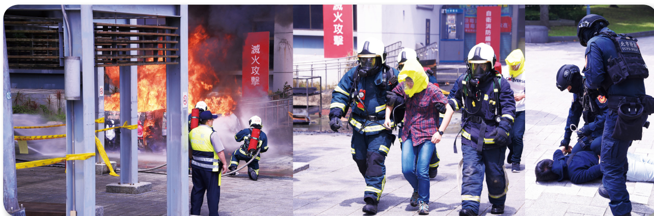
平時利用演練與演習可驗證、檢討與改善各項災害處置對策。圖為 2017 年臺北市舉行萬安 40 號演習，演練發生「信義區聯合行政大樓遭敵縱火及挾持民眾狀況」之應變措施。