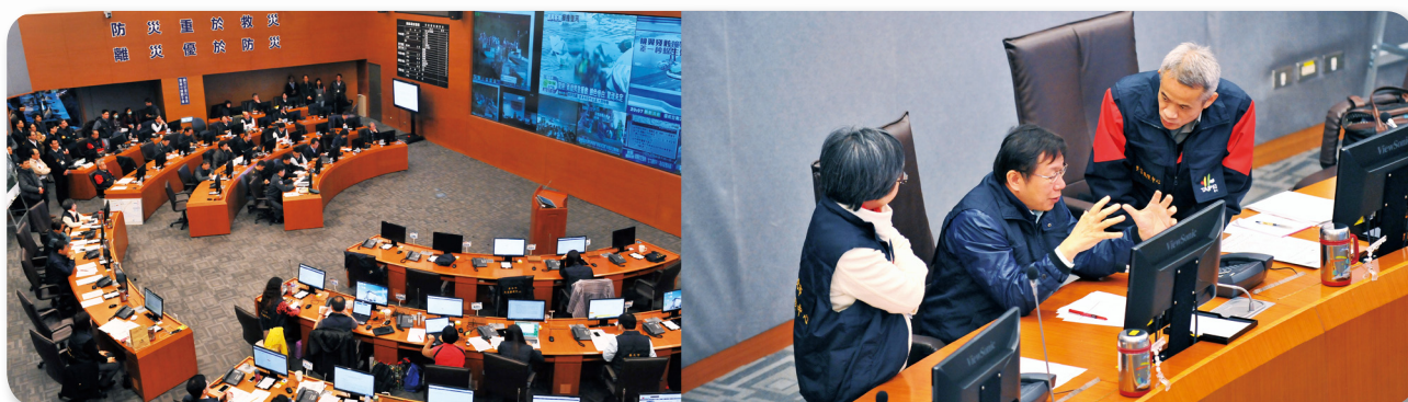
災害發生時，規劃設置災害事故應變組織、機制以及處置對策，可提升救災效率。圖為 2015 年復航空難，臺北市成立災害應變中心，市長坐鎮指揮。

在此工作面向上，須仰賴有效的災害事故應變組織、機制以及處置對策，更應熟稔應變程序，包括指揮調度在內對各項應變技能進行技術與教育訓練。此外，利用演練與演習驗證、檢討並改善各項處置對策與處理程序，於平時即提升對於各類災害事故的應變能力與技術，以確保在事故發生時能夠有效因應，並降低且限縮災害影響的範圍與層面。