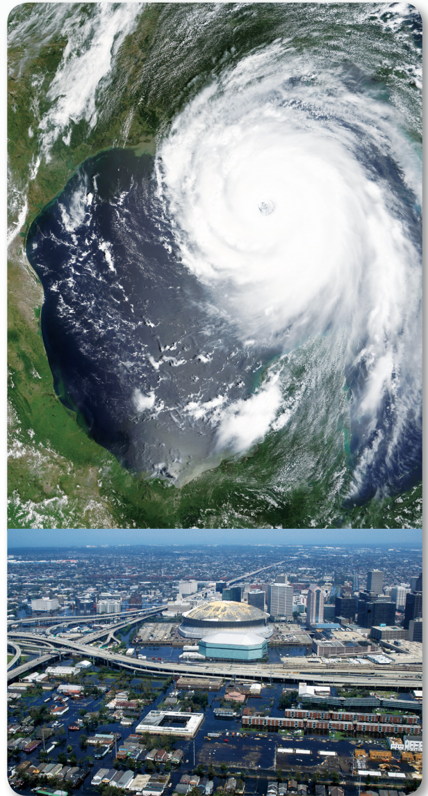
2005 年卡翠納颶風在美國造成重大災害，不僅數千人在這次災難中喪生，各地基礎設施毀損，經濟損失慘重。

全災害可區分為天然災害與人為災害兩大類，而生活在臺灣對於天然災害的類型並不陌生，包括地質災害以及氣象災害