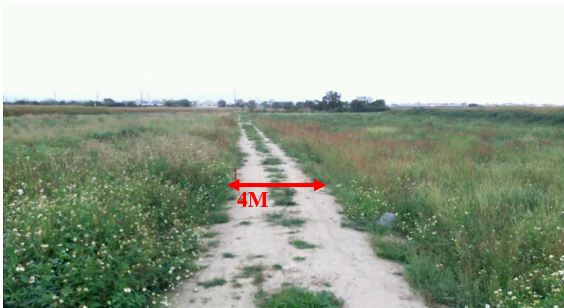
圖片 1：十六甲段 1416-1 地號北側