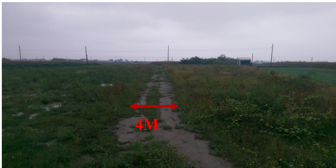
圖片 3：十六甲段 1416-1 地號中段