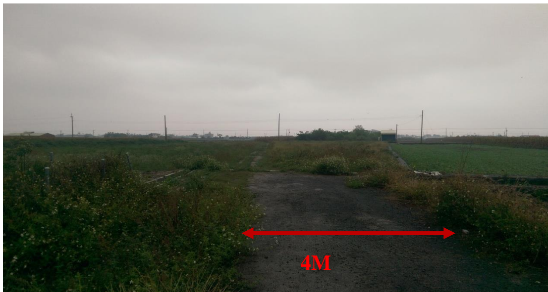
圖片 3：十六甲段 1416-1 地號後段