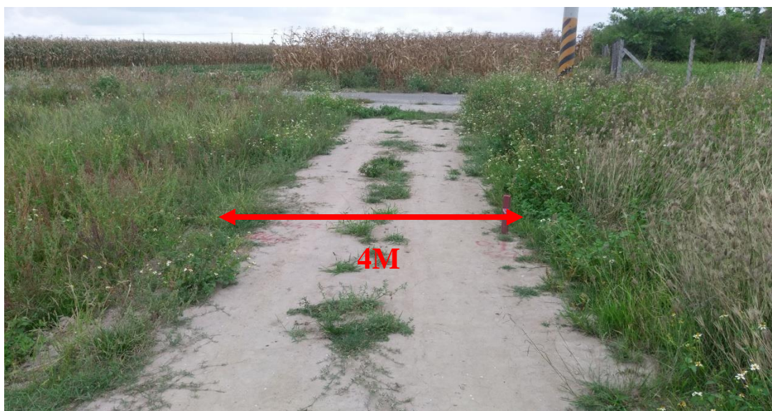
圖片 2：十六甲段 1416-1 地號前段