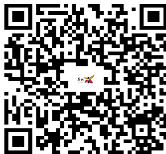
112年度第3批臺南市市有耕地及養殖用地放租土地位置QRcode