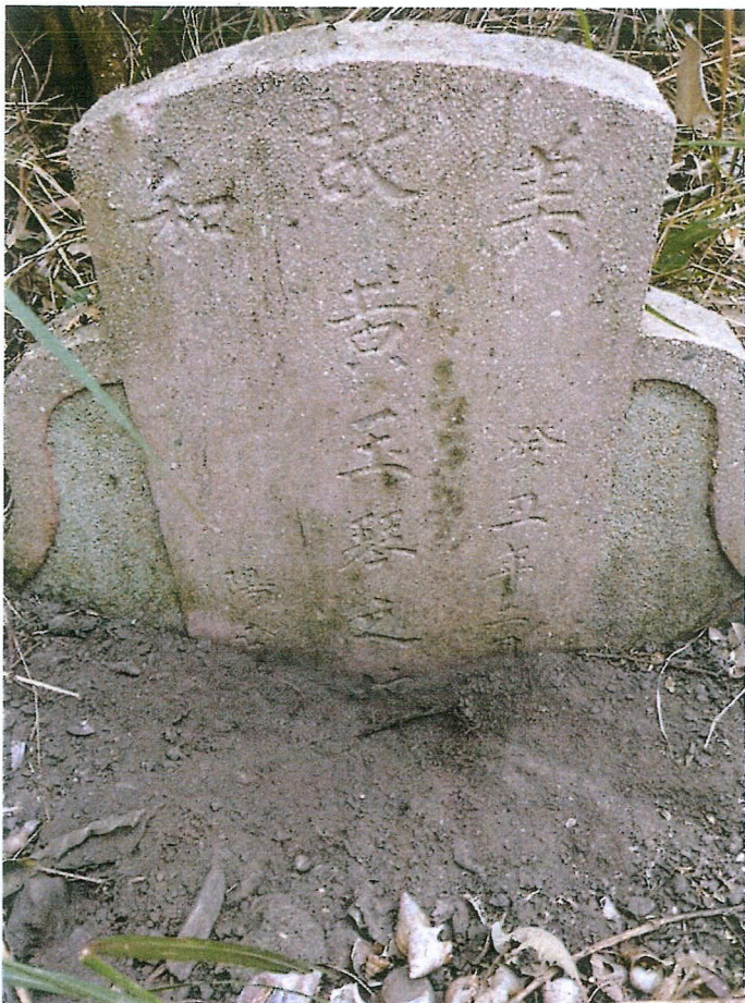
編號三 (被告三 黃玉琴全體繼承人)