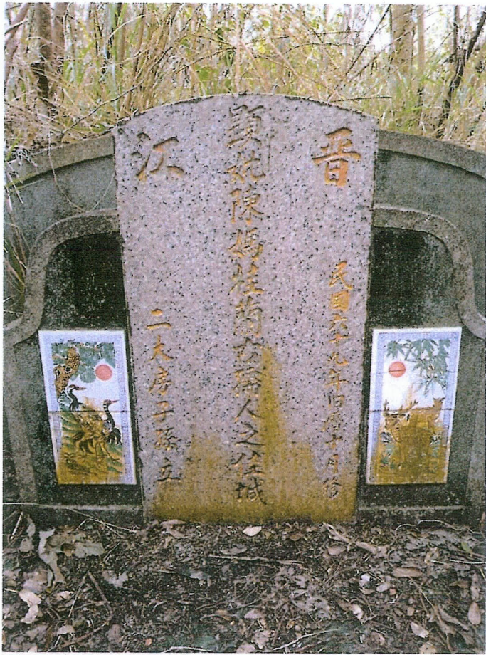
編號一 (被告一 陳桂蘭全體繼承人)