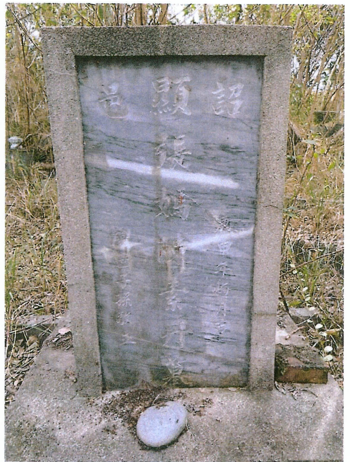
編號四 (被告四 張陳素丹全體繼承人)