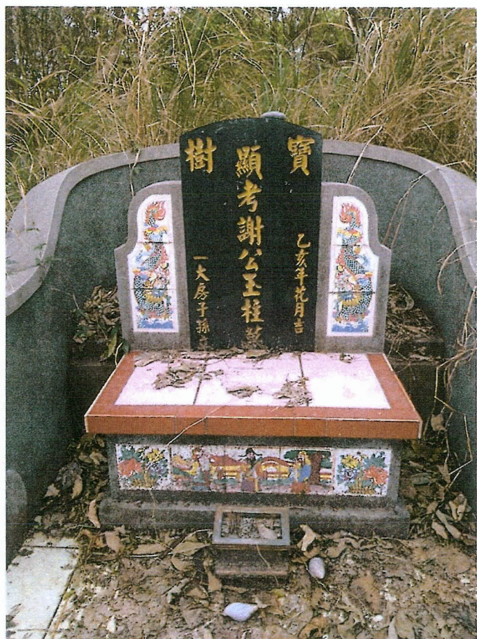
編號七 (被告七 謝玉柱全體繼承人)