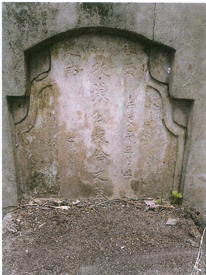
編號五 (被告五 張振倫全體繼承人)