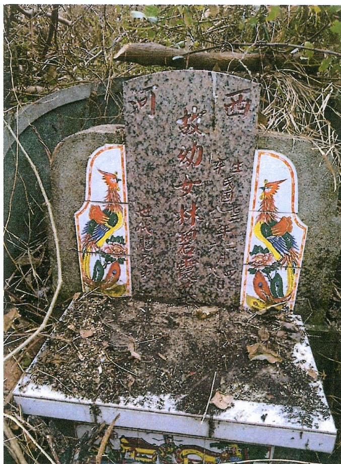
編號八 (被告八 林碧霞全體繼承人)