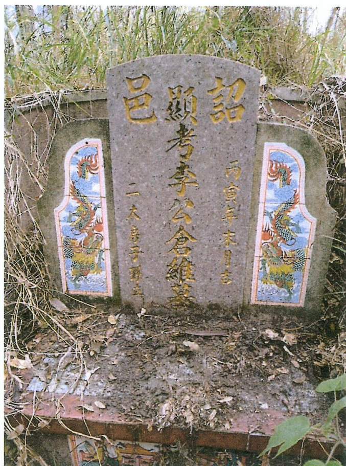
編號六 (被告六 李倉維全體繼承人)