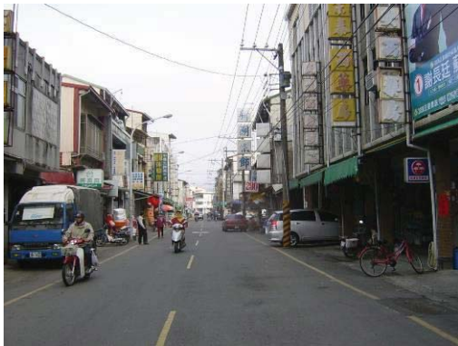
基地西側(中正路)照片