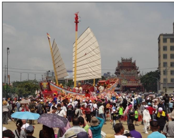
圖 03-安定區真護宮王船祭