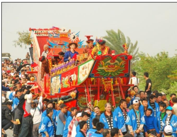
圖 02-安定區長興宮瘟王祭

在行政區域上，明鄭時期「安定」屬「永定里」，清初改「永定里」為「安定里」，「安定」之名首度出現史籍；稍後分成東西兩堡，「安定」劃屬「諸羅縣安定里東堡」，不過習慣上仍沿「直加弄社」平埔社名而稱「直加弄」或「加弄」(cloan)，直至民國9年(1920)地方制度改制，始易稱為今名「安定庄」，戰後再沿此改為「安定鄉」，民國99年12月25日，因臺南縣、市合併，改「安定鄉」為「安定區」。(圖02、03)