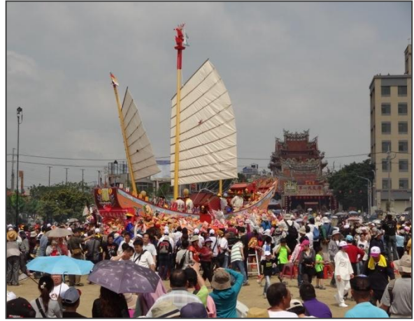
圖 03-安定區真護宮王船祭