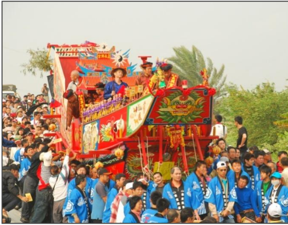
圖 02-安定區長興宮瘟王祭

在行政區域上，明鄭時期「安定」屬「永定里」，清初改「永定里」為「安定里」，「安定」之名首度出現史籍；稍後分成東西兩堡，「安定」劃屬「諸羅縣安定里東堡」，不過習慣上仍沿「直加弄社」平埔社名而稱「直加弄」或「加弄」(cloan)，直至民國9年(1920)地方制度改制，始易稱為今名「安定庄」，戰後再沿此改為「安定鄉」，民國99年12月25日，因臺南縣、市合併，改「安定鄉」為「安定區」。(圖02、03)