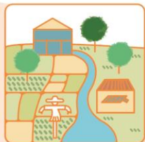
型塑鄉村生活地景