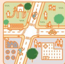
健全地方公共服務