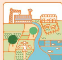
強化在地產業鏈結