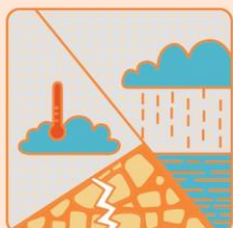
調適氣候變遷策略