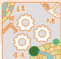
整合公共政策資源