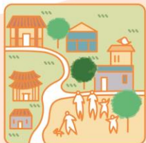
提供必要生活空間