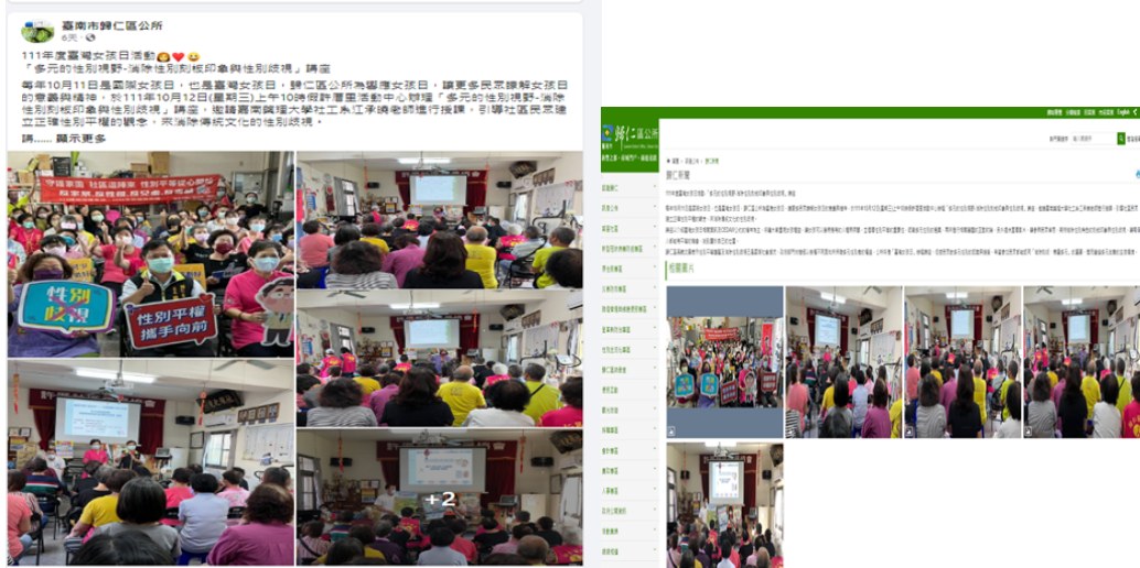
照片說明：參與民眾持宣導標語合影，並置放於本所網頁及FB。