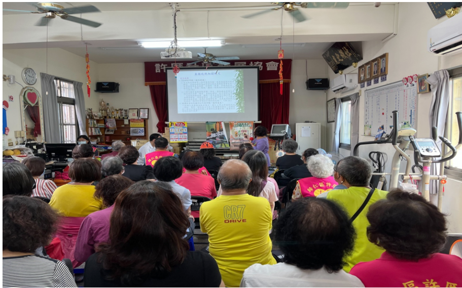
照片說明：宣導 CEDAW 第 28 號一般性建議概念