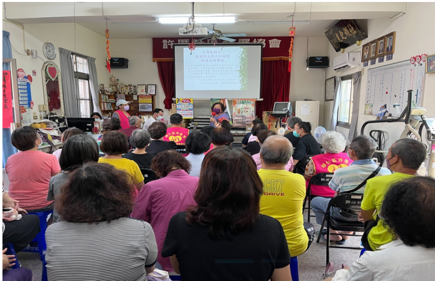
照片說明：介紹臺灣女孩日由來，說明政府促使女孩展現多元潛力及珍視女孩價值。