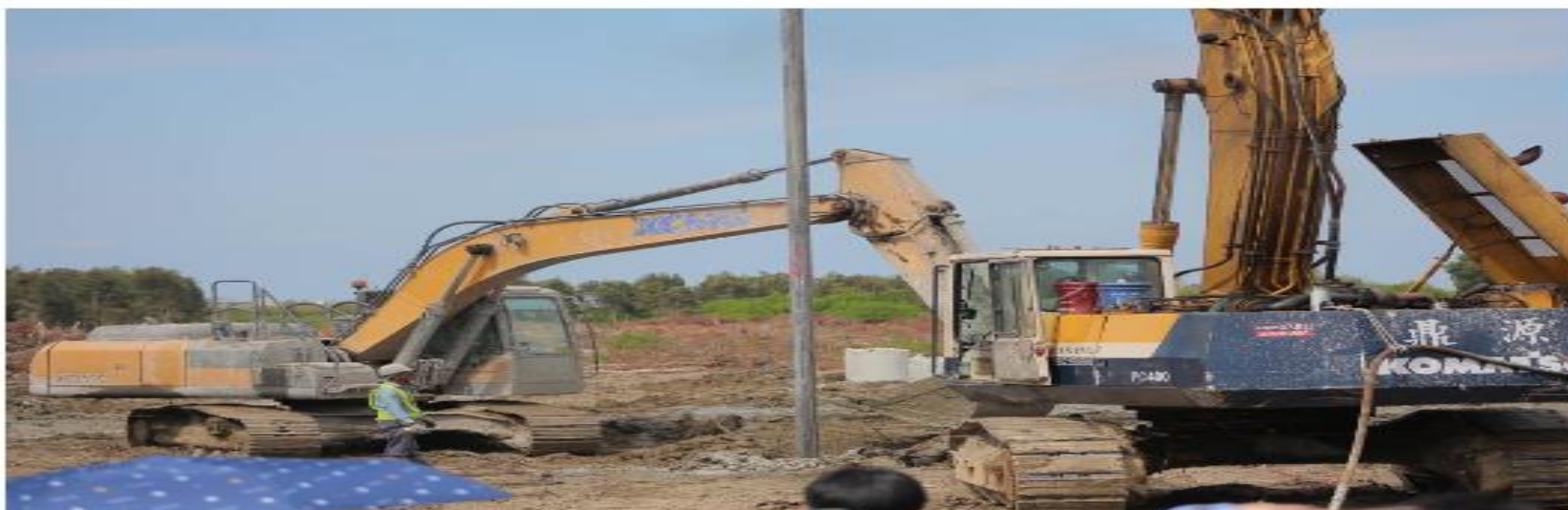
工地現場可見大型機具進駐，持續施作工程。