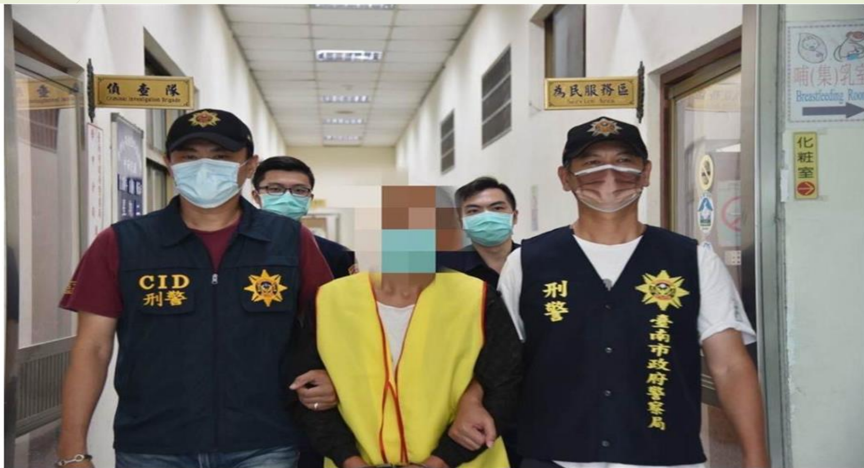
謝姓男子(中)涉嫌勒索在台南市鹽水區太陽能光電案場施工的業者，被台南地檢署依恐嚇取財罪嫌提起公訴。