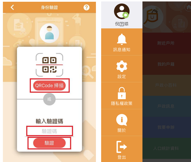
圖 9 操作 APP 完成身分驗證流程說明圖 2