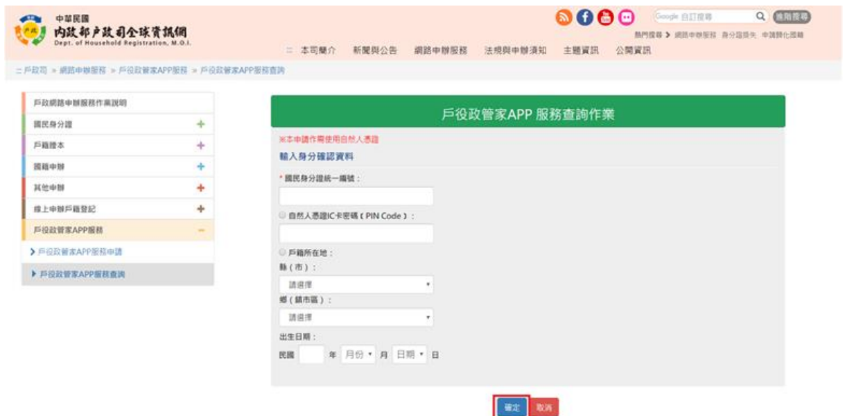
圖 10 戶役政管家 APP 服務查詢作業畫面

於「戶役政管家 APP 服務查詢作業」畫面中，輸入所有必填欄位後，按「確定」之功能鍵，檢驗輸入資料。