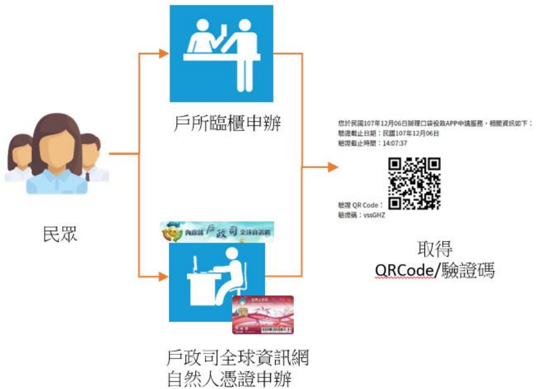
圖 4 身分驗證流程示意