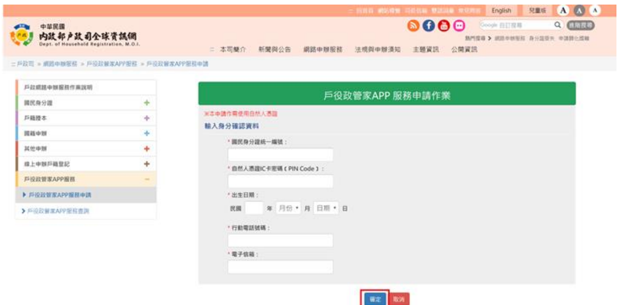
圖 6 戶役政管家 APP 服務申請作業-資料填寫畫面