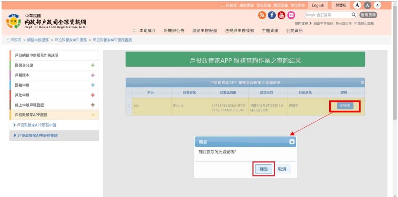
圖 12 戶役政管家 APP 服務查詢作業-點選停用裝置畫面

於「戶役政管家 APP 服務查詢作業」畫面中，點選「停用裝置」之功能鍵，之後按下「確定」鍵。