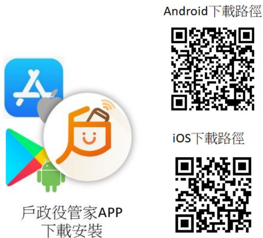
圖 1 戶役政管家 APP 下載安裝圖