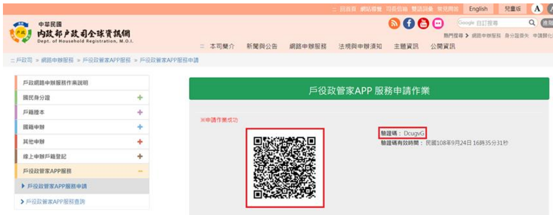
圖 7 戶役政管家 APP 服務申請作業-申請成功頁面