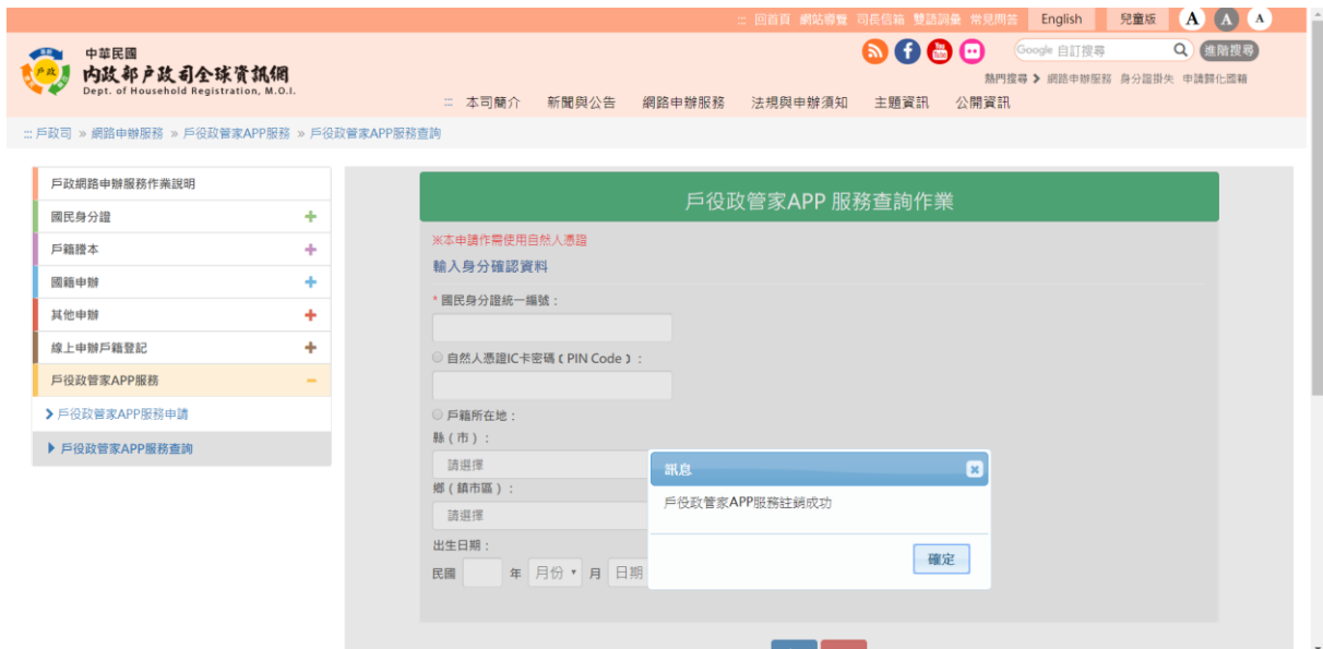
圖 13 戶役政管家 APP 服務查詢作業-停用成功畫面