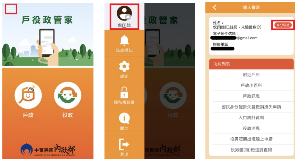
圖 8 操作 APP 完成身分驗證流程說明圖 1