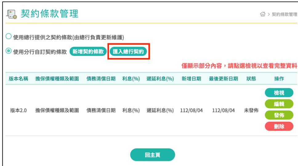
圖 237 契約條款設定，手動匯入總行契約條款