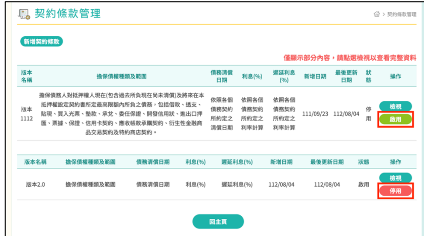
圖 234 契約條款設定，啟用/停用契約條款按鈕