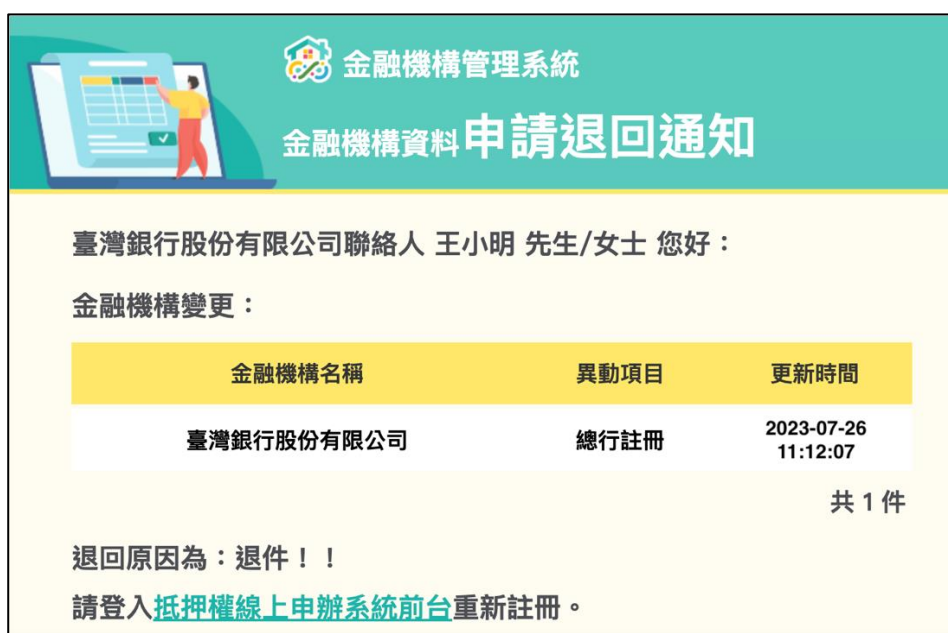
圖 9 總行註冊，審核退回通知信