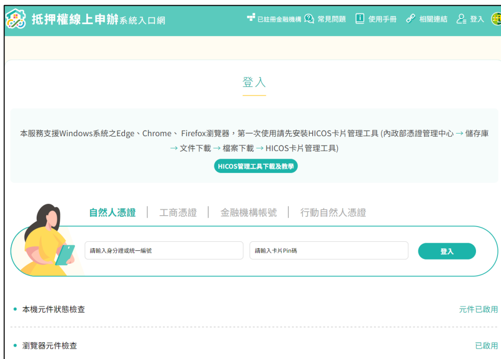
圖 3 抵押權線上申辦系統入口網工商憑證登入頁面