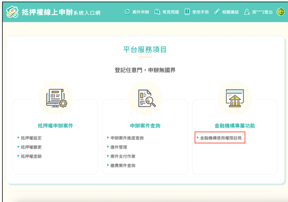
圖 4 金融機構使用權限註冊