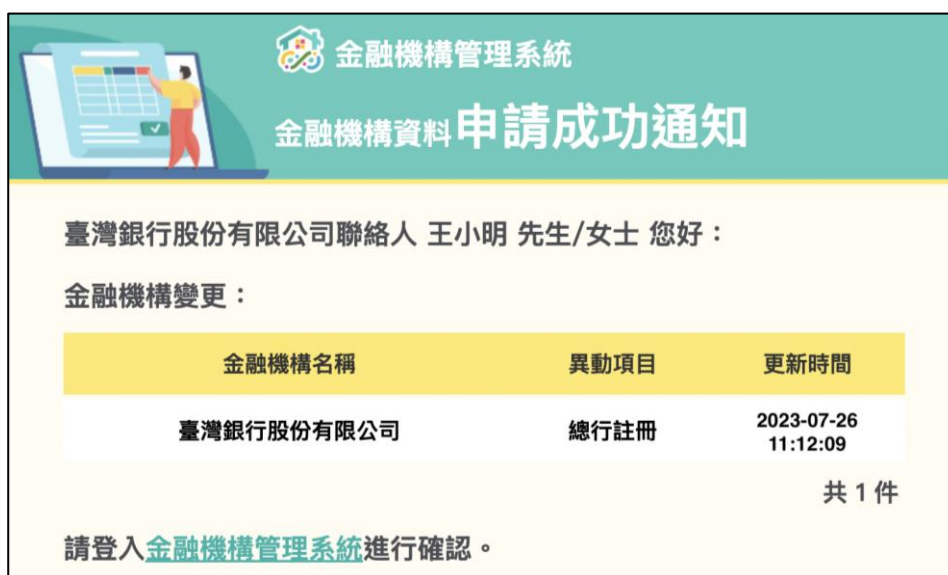
圖 8 總行註冊，審核成功通知信