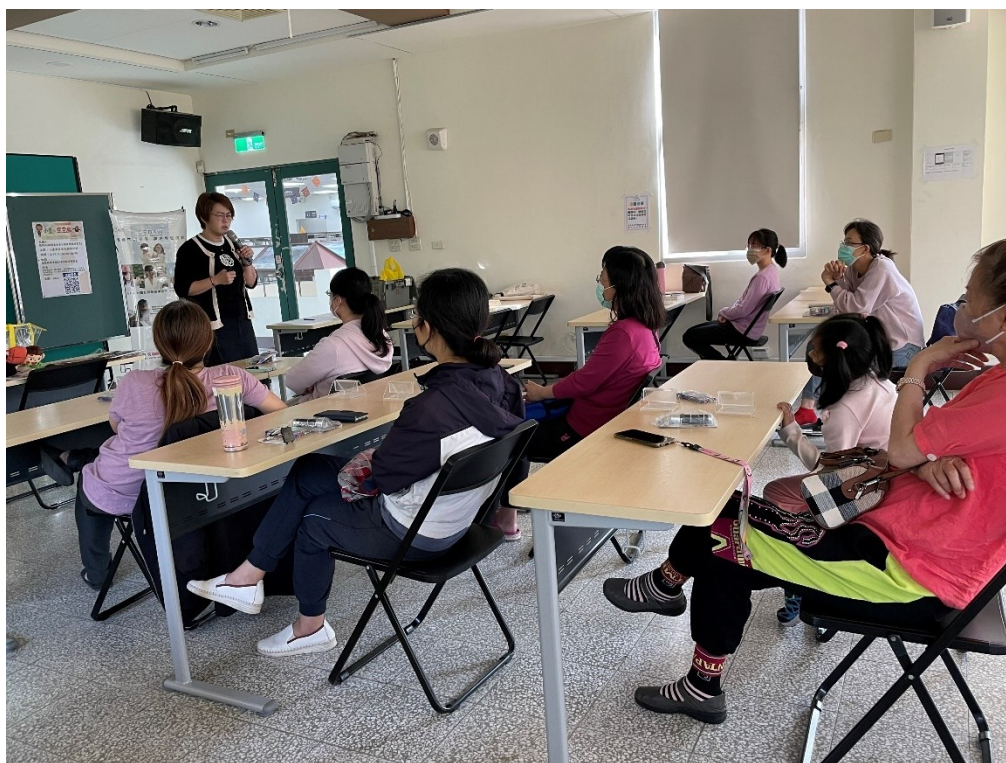
講師與學員分享兒童性侵的實際案例