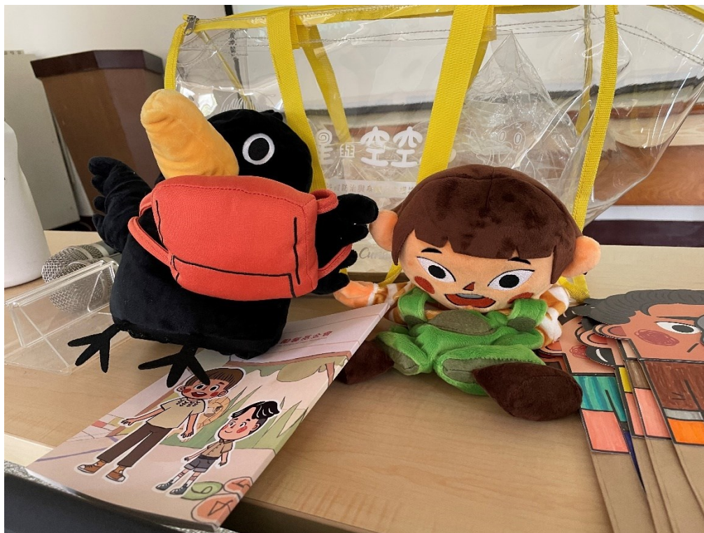
《小星與空空鳥》教材包