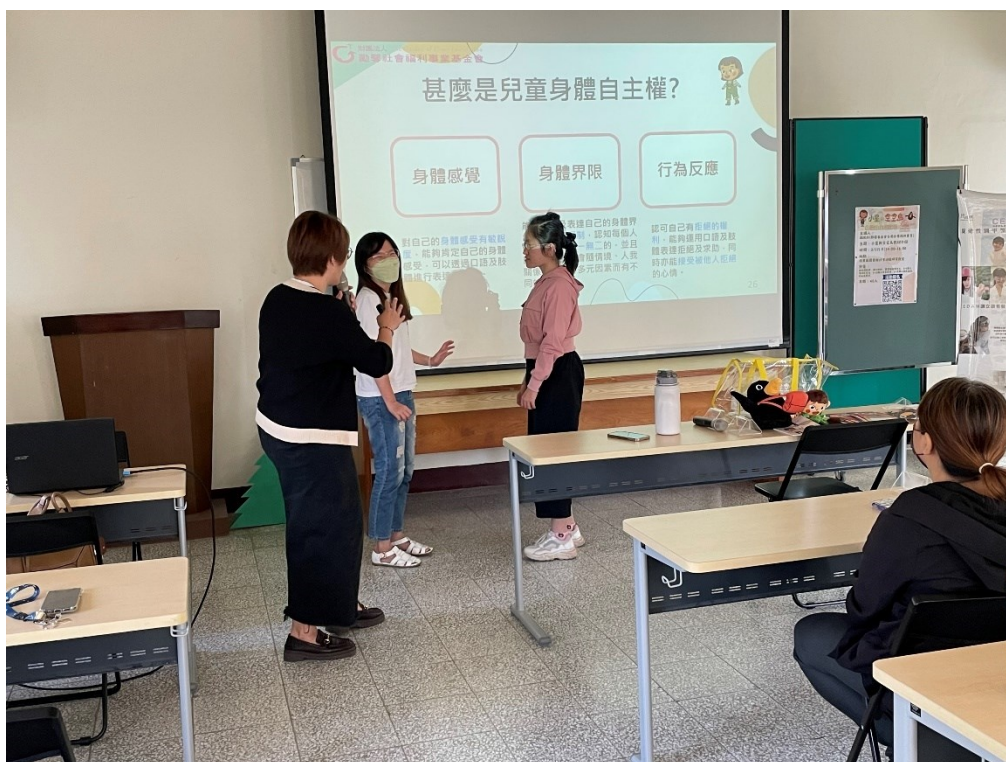
由學員練習實作體驗身體界限