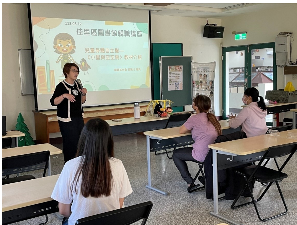
講師與現場學員分享兒童身體自主權