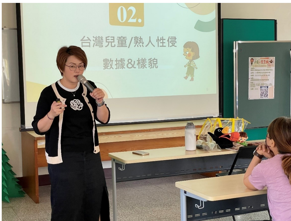
講師闡述台灣兒童遭遇熟人性侵的數據及樣貌