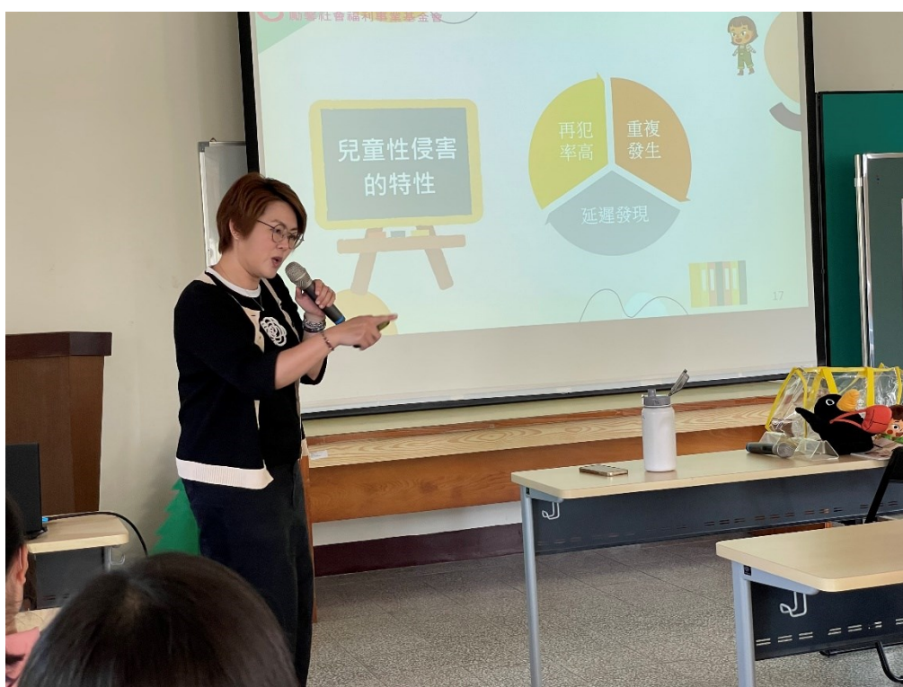
講師闡述兒童性侵害事故的特性：重複發生、延遲發現、再犯率高