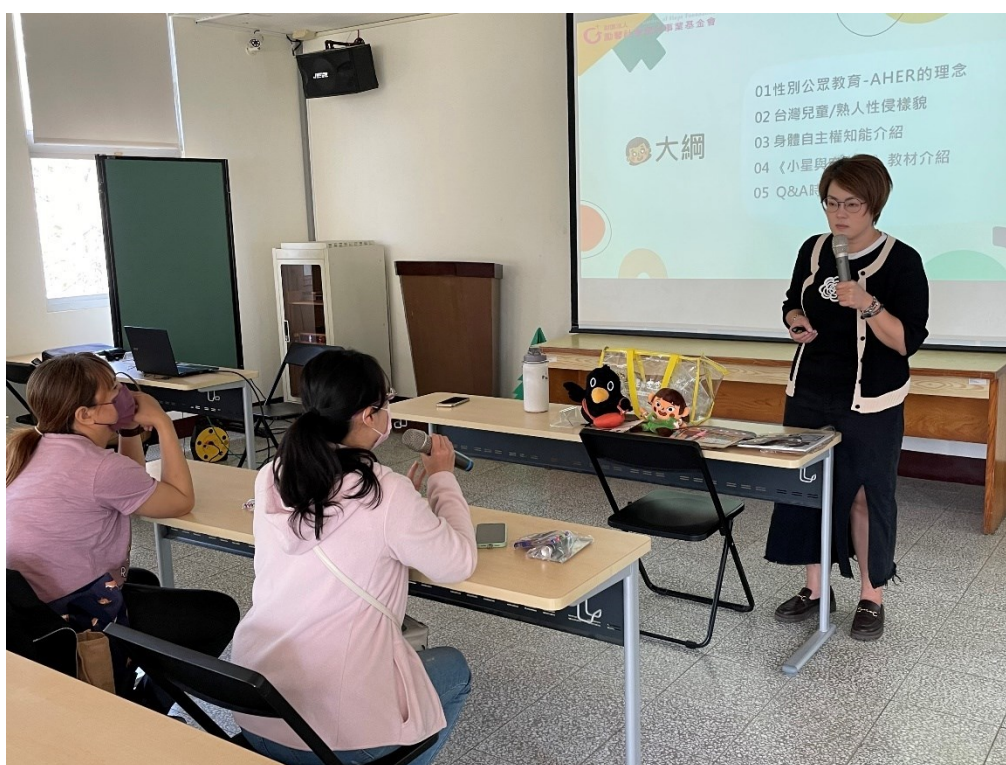
現場學員分享自己認知的熟人性侵態樣