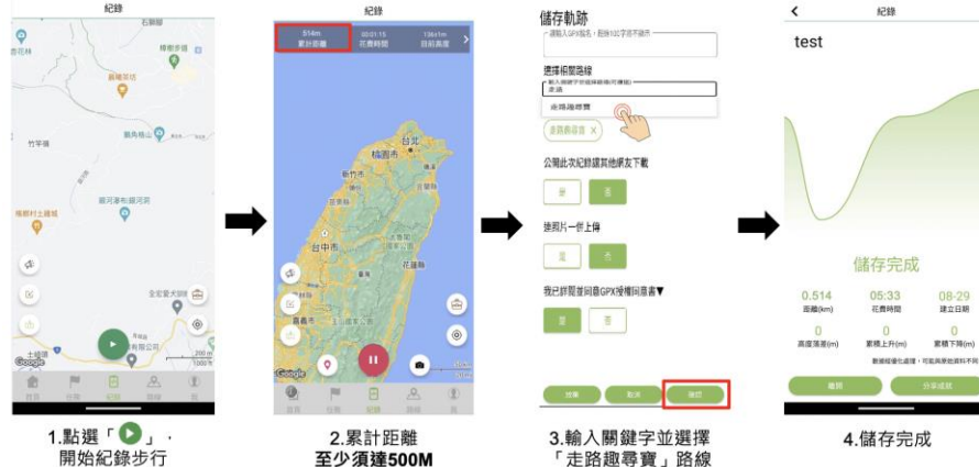
圖 4、Android 系統流程說明