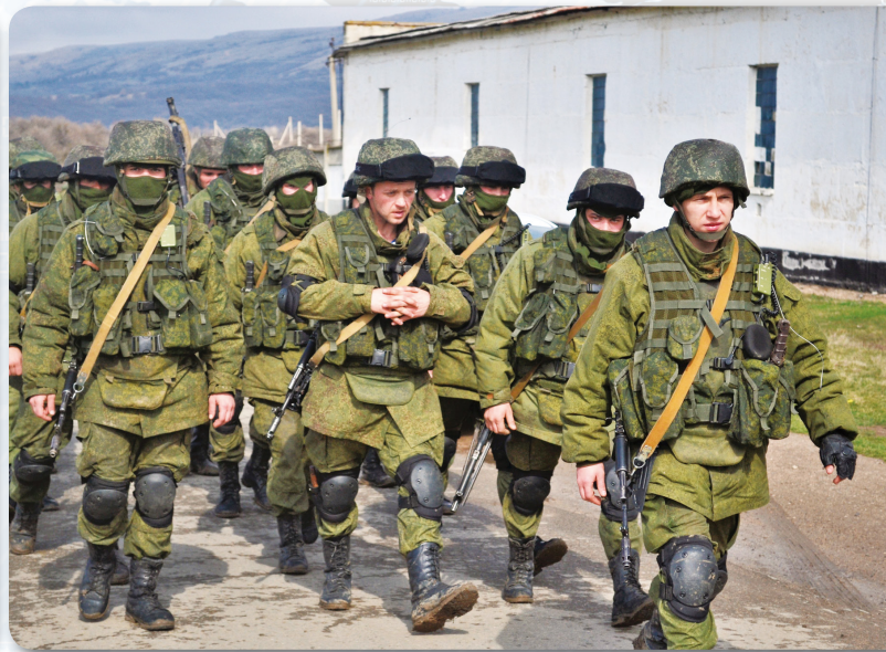
「小綠人」是指沒有任何國際標識的俄羅斯秘密武裝人員。