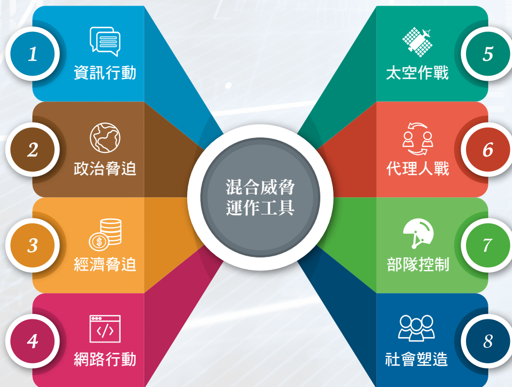
圖 1 混合威脅的運作工具

使用非法融資或能源脅迫，以實現經濟目標或使對手造成經濟損害。例如俄羅斯在關鍵時刻針對性地停止向附近國家供應能源；中國大陸對沒有明顯經濟回報的第三世界國家之關鍵基礎設施項目進行投資。