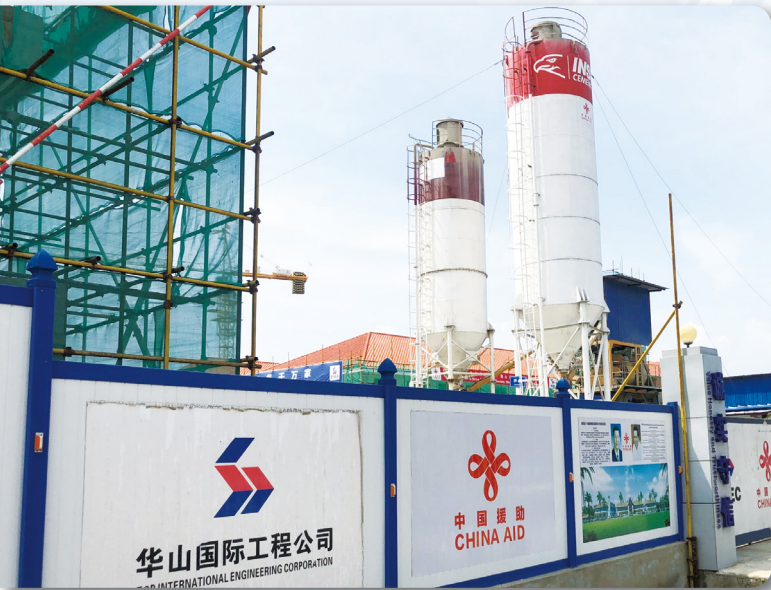
中國大陸於斯里蘭卡波隆納魯瓦投資建造腎病醫院。