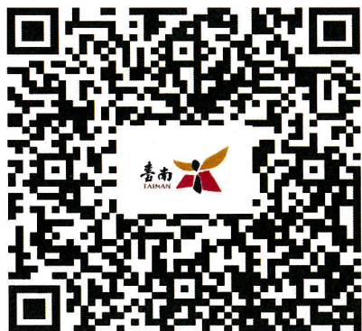
111年度第3批臺南市市有耕地及養殖用地放租土地位置QRcode