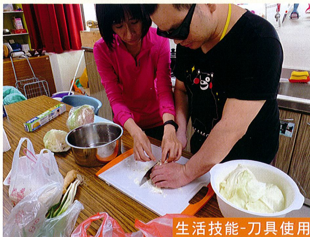
生活技能-刀具使用

食材選購、簡易食物烹調、衣物及環境整理、個人護理及衛生訓練、一般家電用品或 3 C 電子用品操作等生活技能訓練。