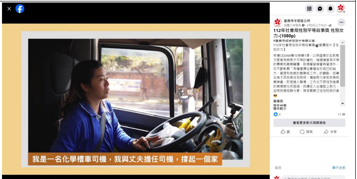
↑ 照片說明：貼文截圖