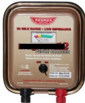
圖二：(直流電)電牧器(供電電源：DC12V或12電池；最大能量傳輸距離20公里；輸出電壓：11KV；脈衝週期時脈衝電流：110mA或180mA；使用注意事項：(1)須安裝接地線(避免雷擊損毀)；(2)接電時應做好導線絕緣措施；(3)使用電壓檢測器量測電瓶電壓；(4)不可直接置於戶外任風吹雨淋；(5)農地較不適合使用太陽能型電牧器；(6)要經常巡查有無異物在電牧導線上避免漏電。)