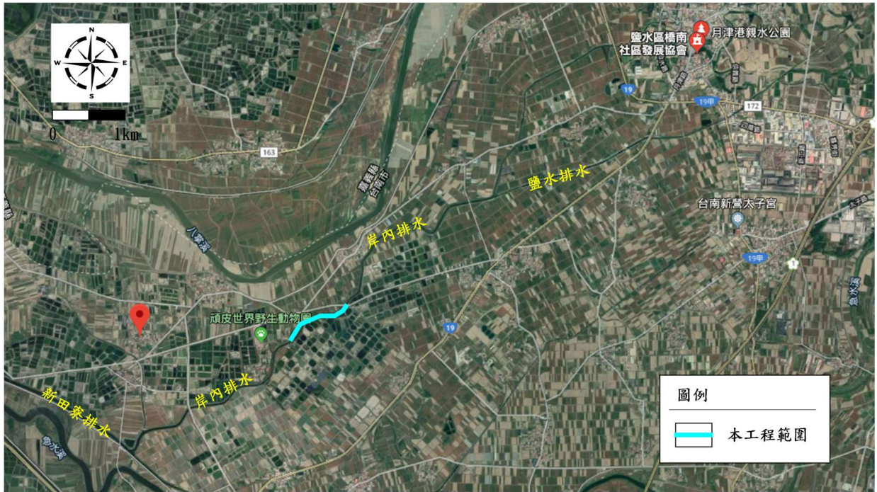
圖 1 本工程位置示意圖