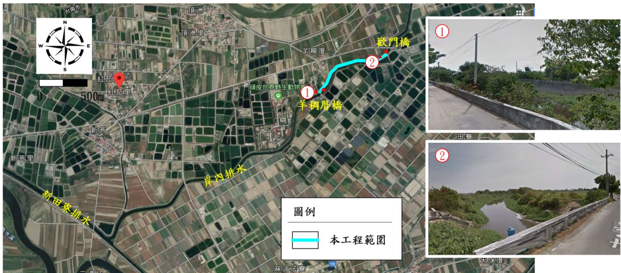
圖 3 本工程範圍內現況示意圖

範圍內土地改良物概況主要為農田、魚塭、農路與排水設施為主，如圖 3 所示。(實際概況以現場查估為準)