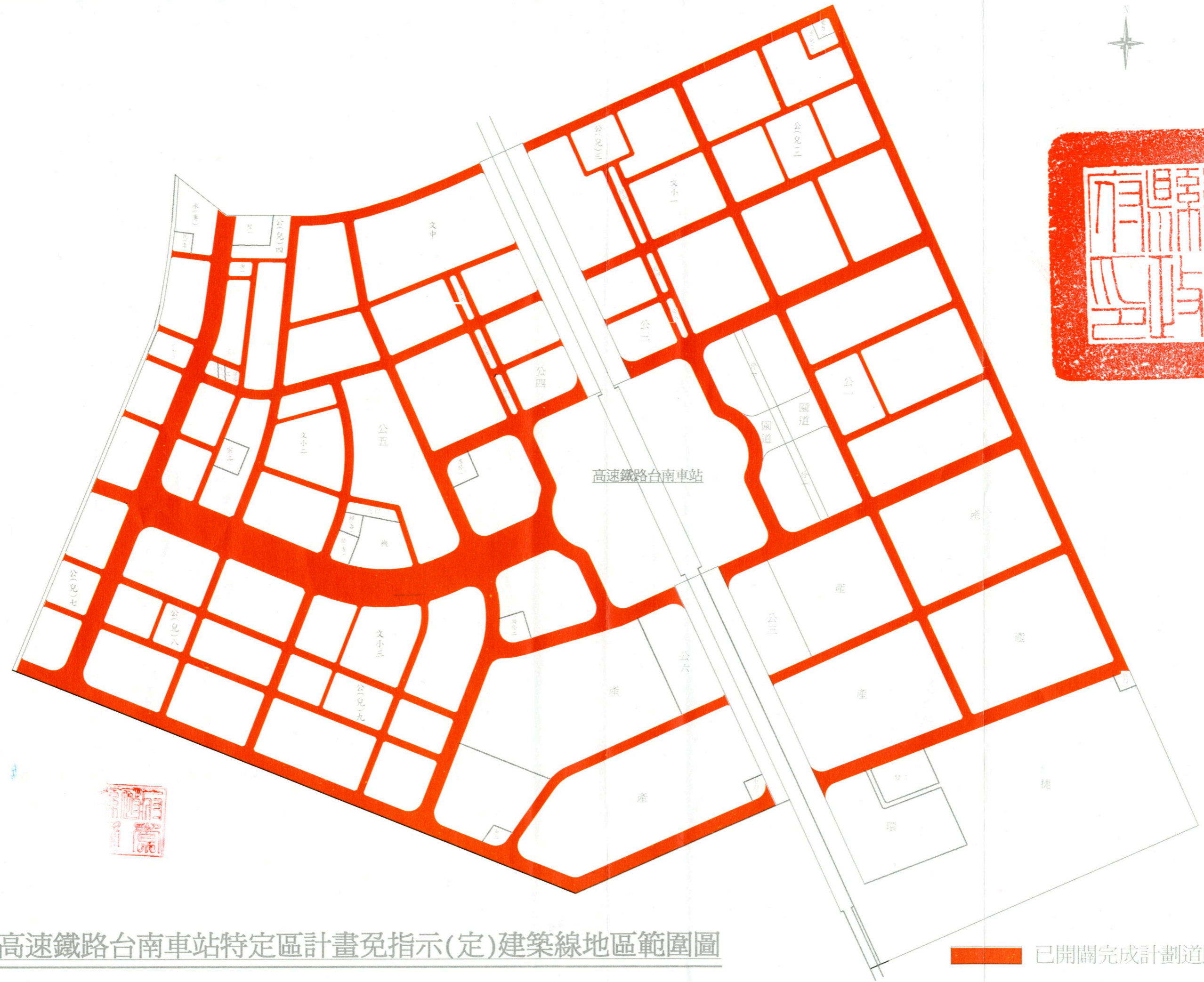
高速鐵路台南車站特定區計畫免指示(定)建築線地區範圍圖