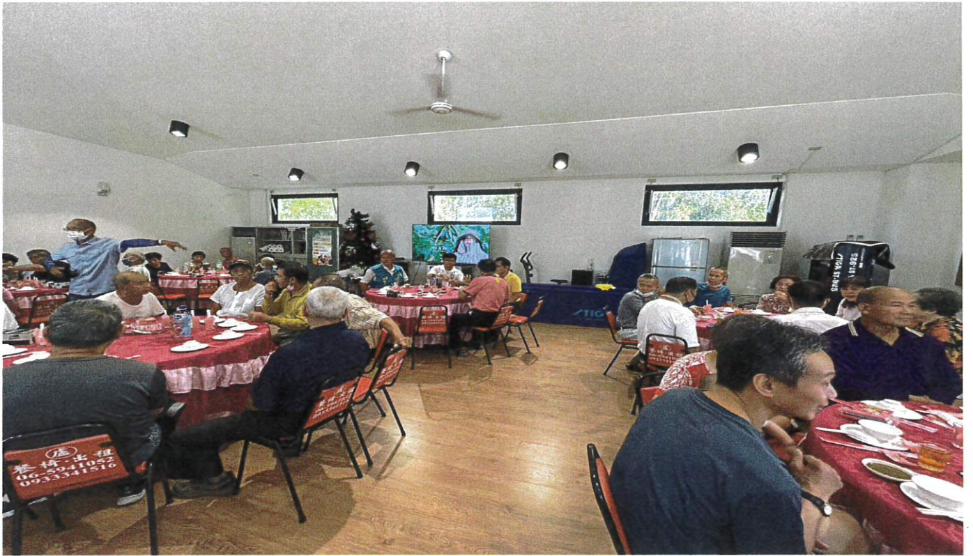
本所民政及人文課辦理 112 年土崎里重陽節聯歡會活動