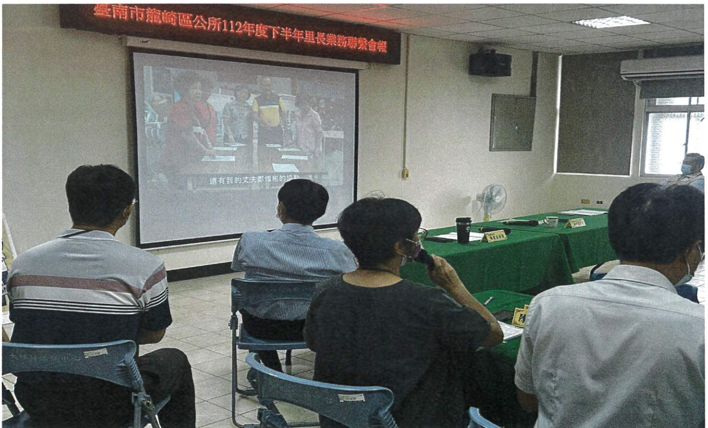
播放市府「大內高手·握鋤之手也能拿麥克風」CEDAW 宣導影片