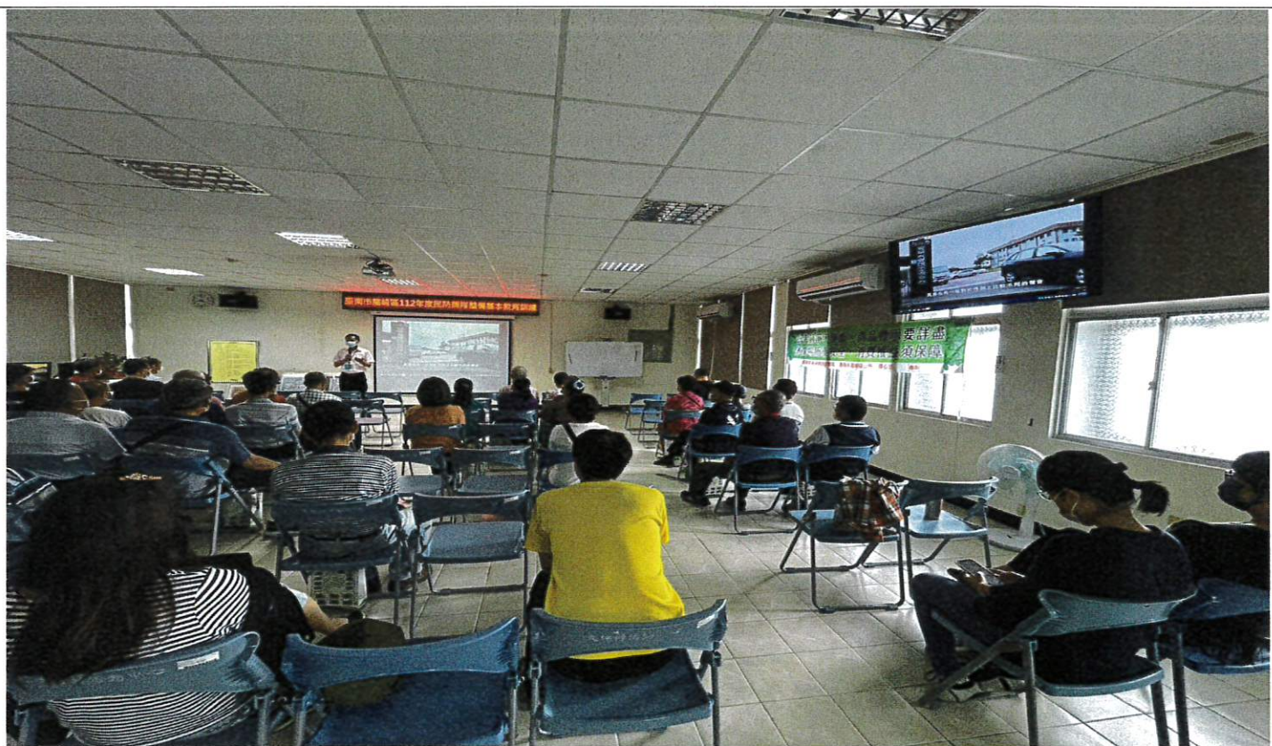
播放本府「女力扎根·性平萌芽」(水利局版)CEDAW 宣導影片