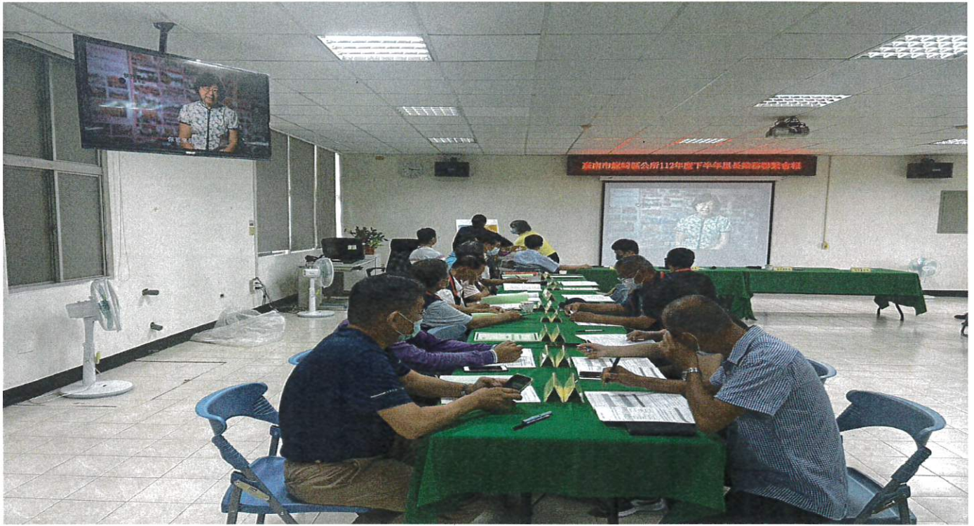
本所民政及人文課辦理「112年度下半年里長業務聯繫會報」活動