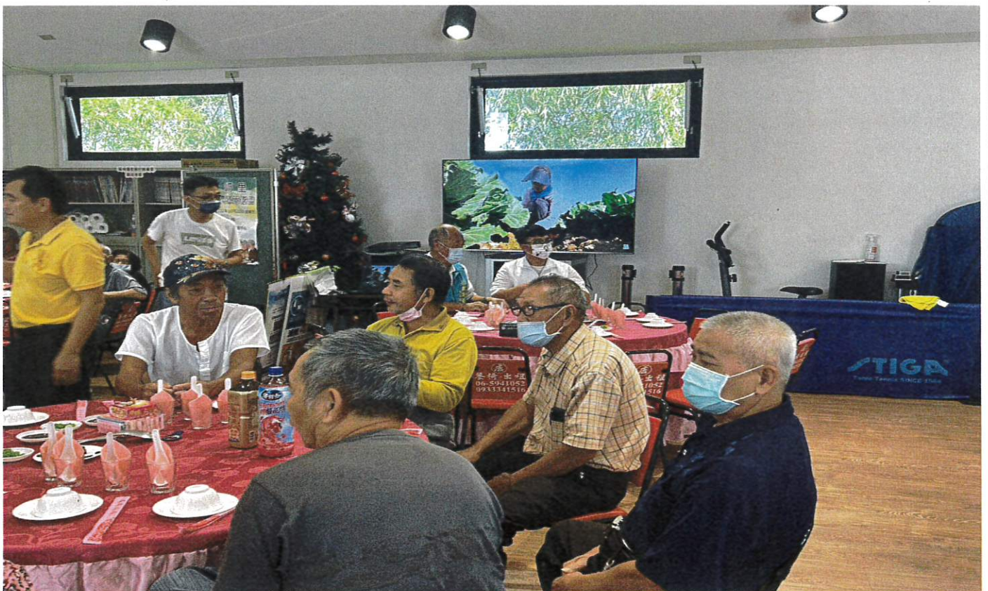
播放市府「南農女力」CEDAW 宣導影片