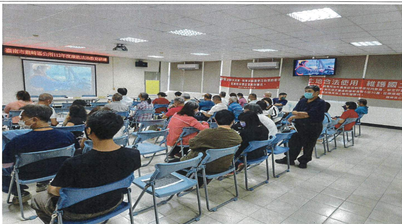
播放市府「環境清潔 女力先鋒」CEDAW 宣導影片