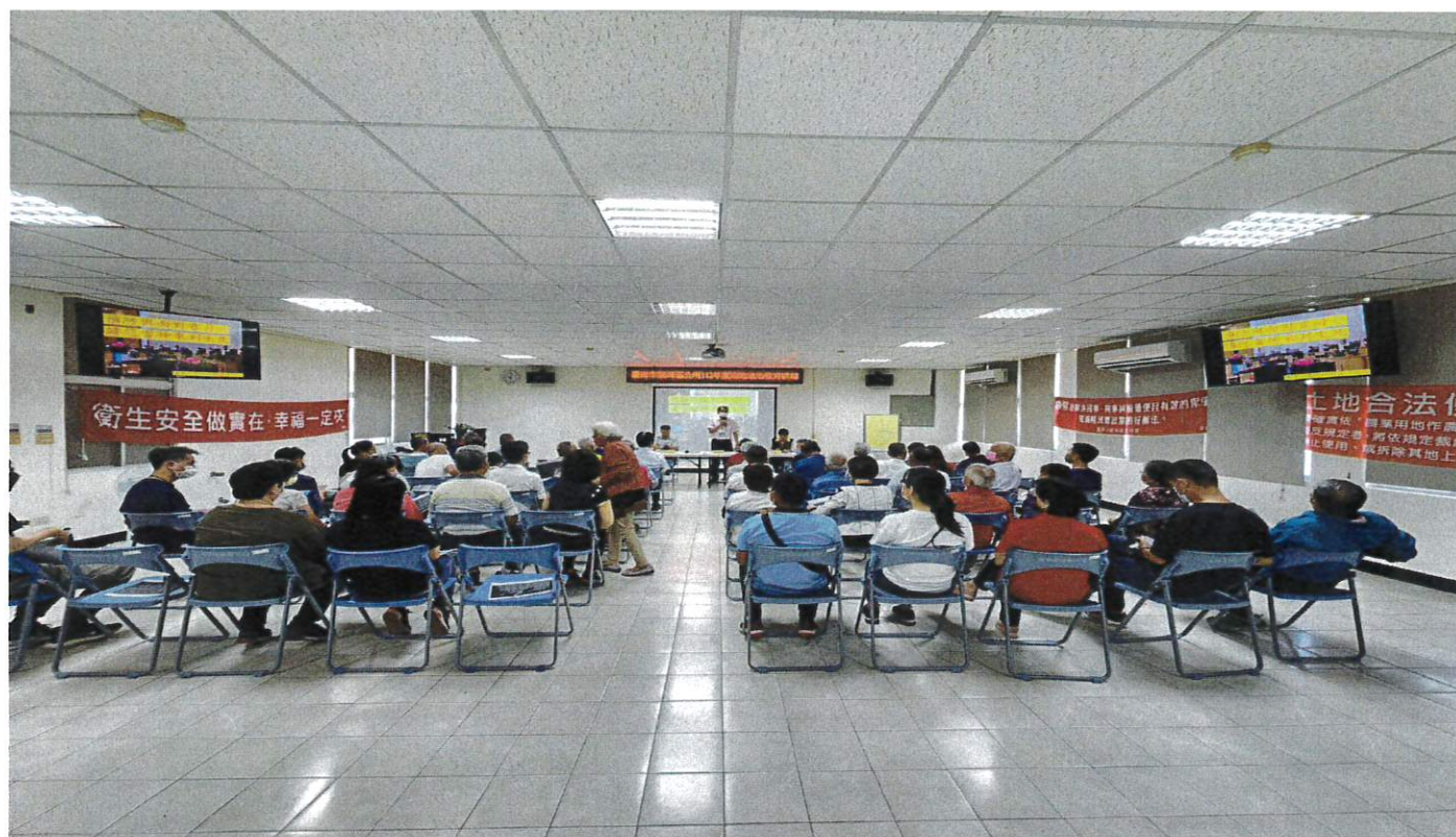
本所民政及人文課辦理國民法官宣導會