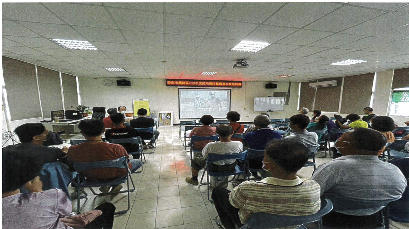
本所民政及人文課辦理「112年民防團隊整備基本教育訓練」活動